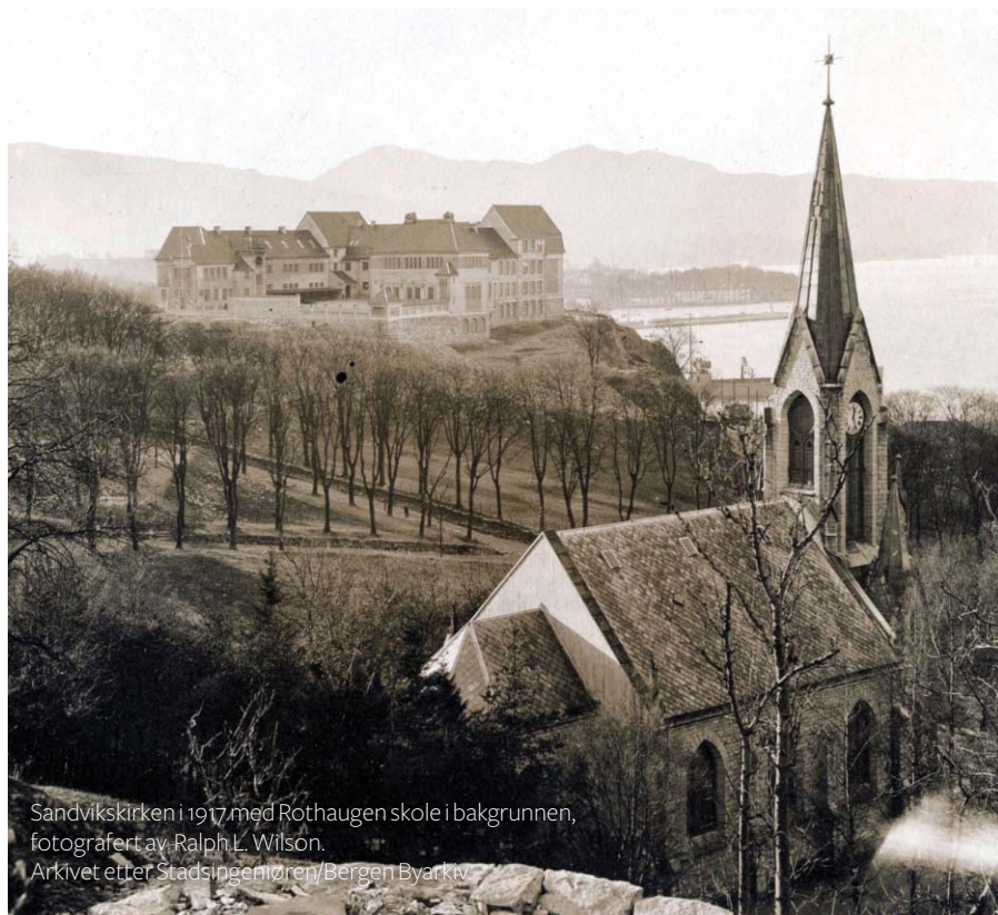
Sandvikskirken i 1917 med Rothaugen skole i bakgrunnen.