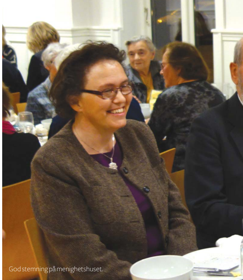
God stemning på menighetshuset.