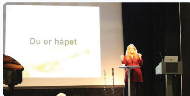
Hilde Frafjord Johnson taler på konferansen.

Men for de som er kommet til Norge – finnes det håp for dem? Det er opp til oss, sa hun, og kom med flere trefende karakteristika ved oss nordmenn.