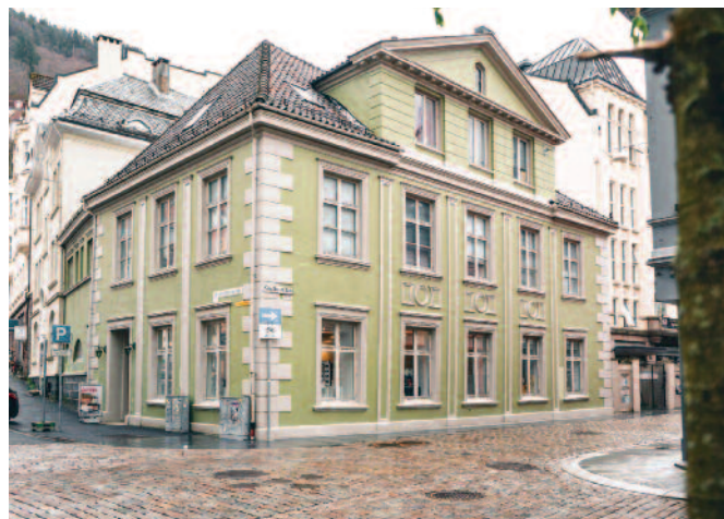
VAKKERT BYGG: Det er lett å finne BKB i krysset mellom Kong Oscarsgate og Øvre Korskirkealmenningen