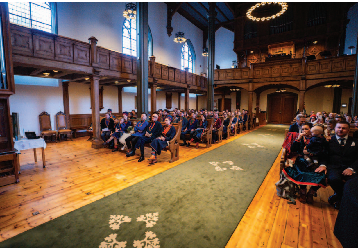
NY OPPLEVELSE: Lulesamisk bryllup og barnedåp i Sandvikskirken.