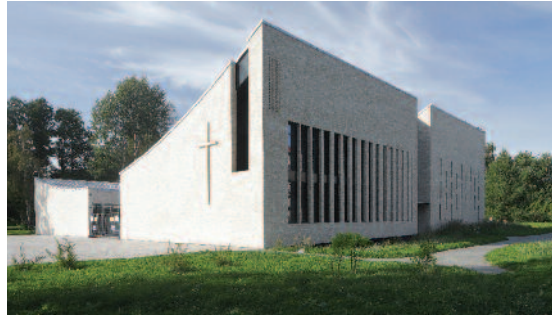
Til venstre: Den nye kirken i Tallin. Bygget ble innviet i fjor.

– Vi kommer sammen første mandagen i måneden kl.12. Vi deler Guds Ord, ber, synger, deler misjonsinformasjon og en kopp kaffe. Fellesskapet betyr mye og alle gleder seg til møtene som nå holdes hos meg i Kirkegaten 6. Og