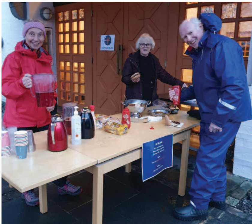
Alternativ uteservering - «koronastyle».

2022 er Frivillighetens år i Norge. Kanskje ønsker du å være frivillig? Hva er mitt interessefelt? Hva er jeg god til - og hva ønsker jeg lære mer om? Gjennom dugnadsarbeid får vi muligheter til å synliggjøre og bruke våre evner og kompetanse. Alle kan bidra med noe og kanskje lærer man noe nytt? Fellesskapet i møte med de