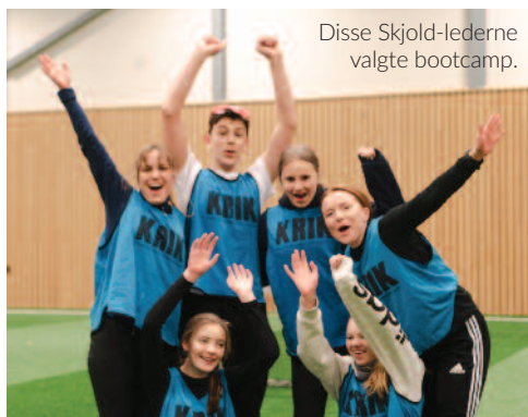
Disse Skjold-lederne valgte bootcamp.