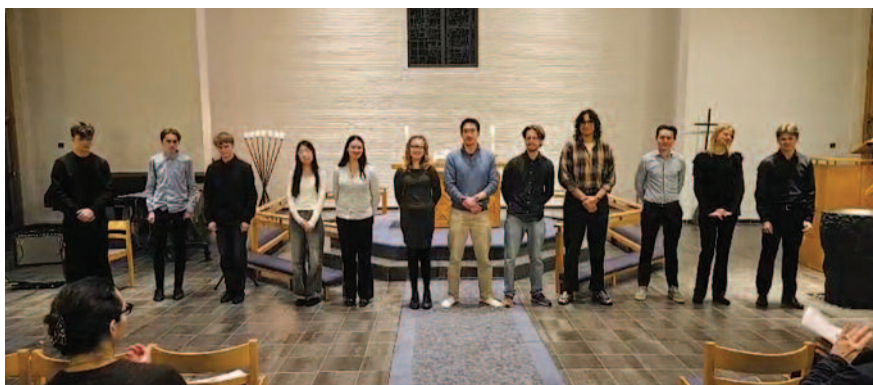
▲ MANGE MED: Søndag 1. februar var det musikalsk festkveld i Skjold kirke.