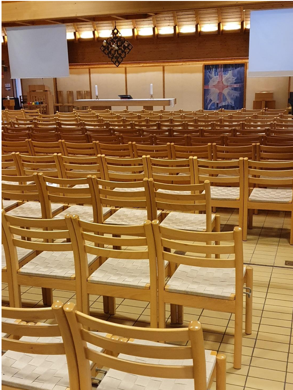
Vår flotte kirke!