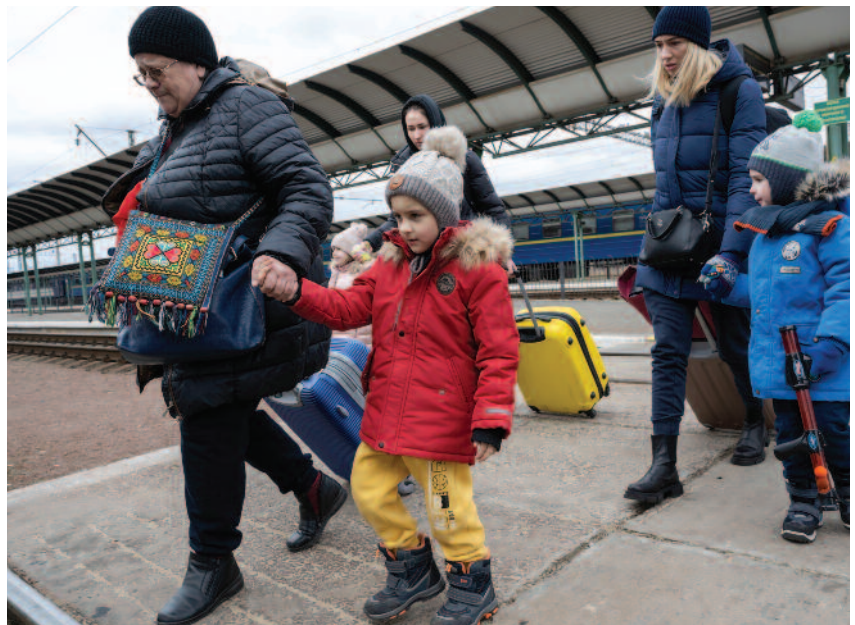
Ukrainere på flukt. Bildet ble tatt 11. mars.

Kirkens Nødhjelp rykket raskt inn sammen med sine partnere og bidrar med livsviktig hjelp til flyktninger, både i Ukraina, Ungarn, Romania og Polen. Kirkens Nødhjelp har et godt nettverk i området gjennom den internasjonale humanitære alliansen ACT Alliance. I tillegg arbeider den polske samarbeidspartneren Polish Humanitarian Action på tolv ulike steder i