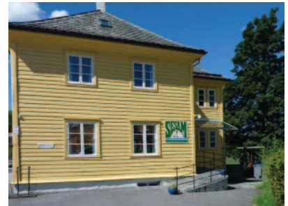
«Det gule huset» på Nesttun.

– Vi skal våge å se utfordringer i menneskers liv, og møte menneskelig