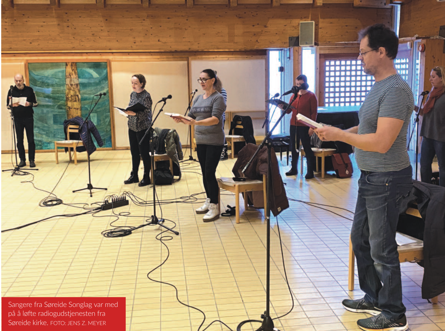
Sangere fra Søreide Songlag var med på å løfte radiogudstjenesten fra Søreide kirke.

diktet blitt til sangen Kanskje klokken elleve samme kveld.