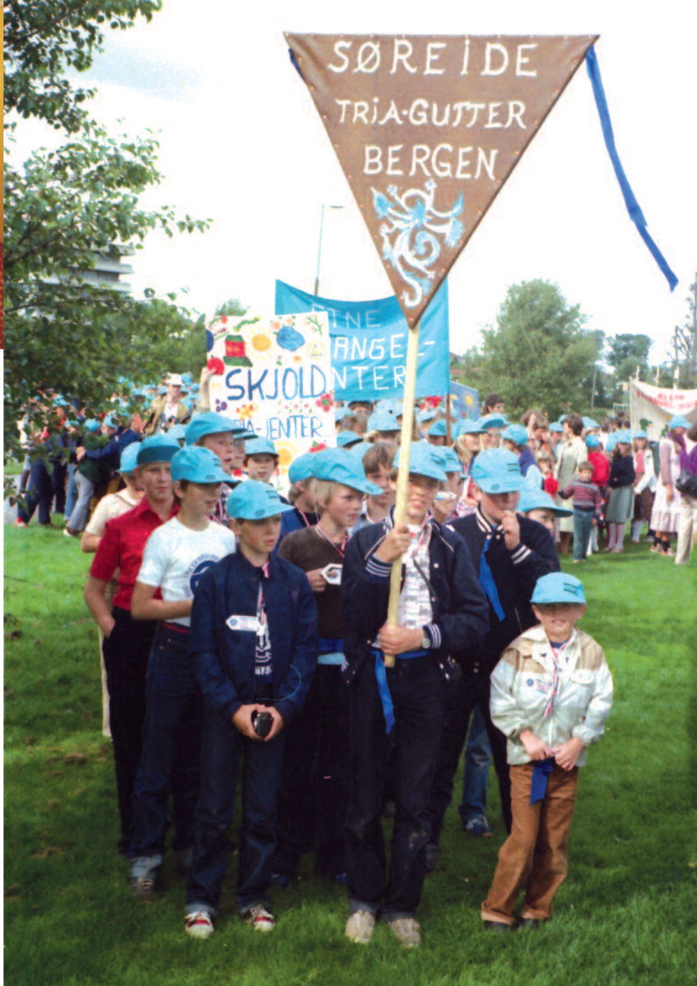
TRIA: Triagutter fra Søreide under egen fane.