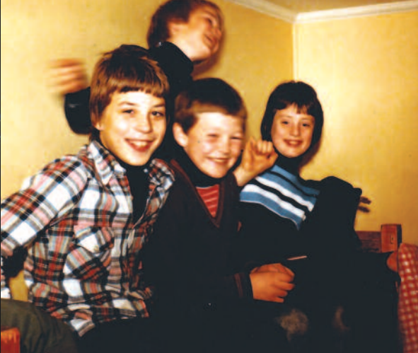
LEIR: Glade gutter på leir.

– Det er mer travelhet i familiene nå for tiden, flere aktiviteter å delta på, både for voksne og barn. En oppgave for blant andre kirken, må være å få folk engasjert og gjennom små oppdrag få den enkelte til å føle at vedkommende er en viktig bidragsyter.