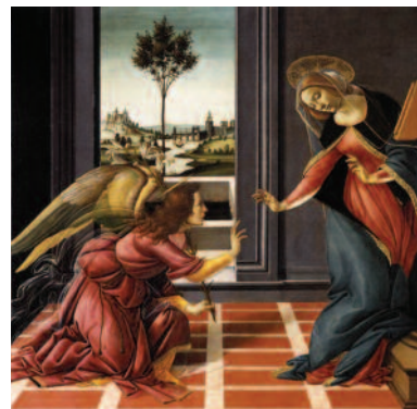
Sandro Botticelli (c. 1445- 1510): «Bebudelsen» (1489).

For å gi noen «knagger» til å møte verkene på har vi invitert innledere til korte gjennomgang av sentrale emner: