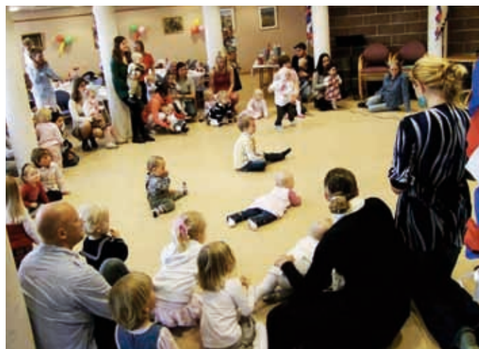
17. MAI I KIRKEN: Barna er i fokus under 17. mai-samlingen i Stjernen åpen barnehage.