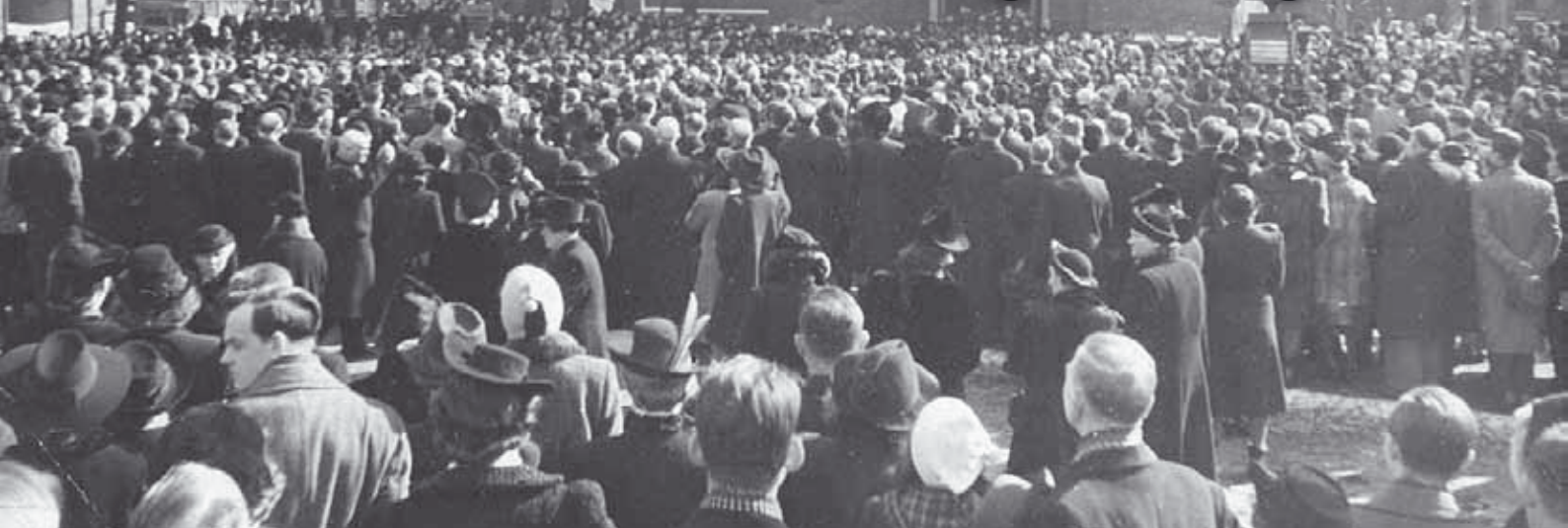
LANGFREDAG, 3. APRIL 1942: Et tusentalls mennesker hadde møtt opp utenfor domkirken i Oslo for å høre gudstjenesten til den avsatte biskop Eivind Berggrav. Imidlertid var biskopen nektet å forrette og arrestert av myndighetene. I protest sang folk «Gud signe vårt dyre fedreland» og «Ja vi elsker» utenfor kirken. Hird og politi forsøkte forjeves å spre mengden.

Påskan har stått svært sentralt i kristendommen i hundrevis av år, og kirken markerer hver vår denne høytiden på bredt grunnlag. Slik vil det også bli i år, når påskan melder seg i første uke av april. Da kan det være grunn til å minnes påskan 70 år tilbake i tid, da alle landets menigheter under gudstjenesten fikk opplest et budskap fra landets biskoper om «Kirkens Grunn».