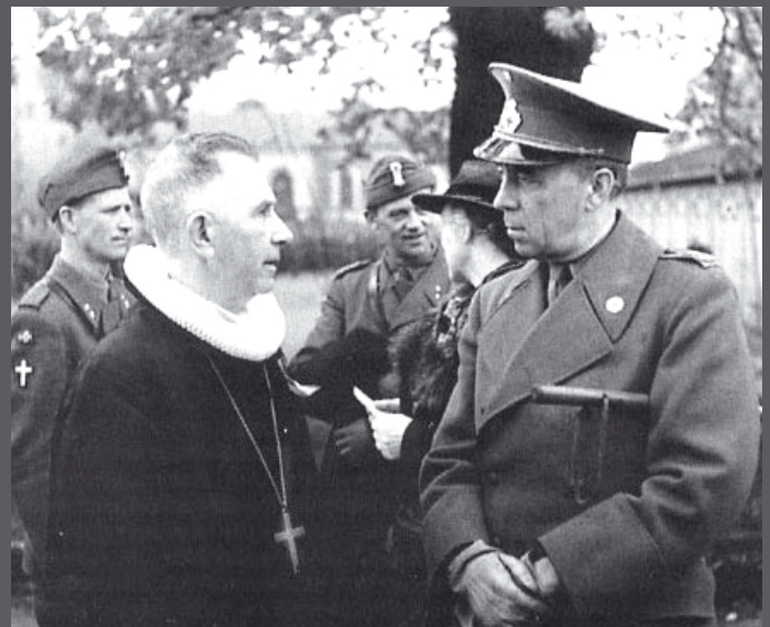
BISKOP OG MOTSTANDSMANN: Biskop Eivind Berggrav i samtale med grev Folke Bernadotte, mannen bak evakueringen med de hvite bussene. (17.mai 1945)