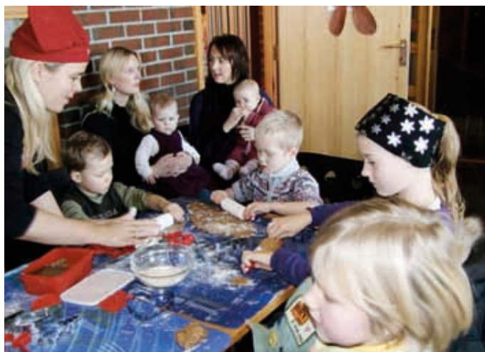
JULEMARKED: Pepperkakebaking er en populær aktivitet for store og små.

Trosopplæringen er et stort økonomisk og ressursmessig løft for menigheten. Vi vil derfor sende en takk til fadrene som har gitt fadder-gaver, foreldre som har gitt positive tilbakemeldinger, menigheten som har gitt i offerposene ved gudstjenester, årlige gaver fra Honnørklubben og Y's men, menighetskomiteene på Flaktveit og Haukås, Åsane menighetsråd, givere, dere som har hjulpet til med de utallige dåpsutsendingene og dere som har bedt for trosopplæringen. Dere har gjort det mulig for menigheten å fortsette med denne viktige oppgaven. Som det heter i dåpsliturgien: «Sammen med denne menighet og hele vår kirke får dere del i et hellig ansvar: å be for barnet, lære det selv å be, og hjelpe det til å bruke Guds ord og Herrens nattverd, for at barnet kan bli hos Kristus når det vokser opp, likesom det i dåpen blir forenet med ham».