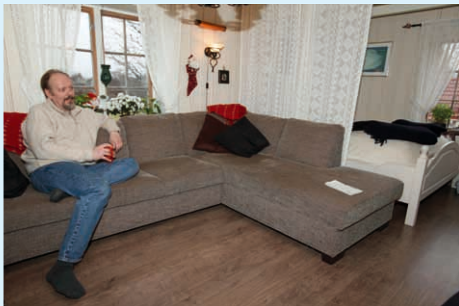
I STUEKROKEN: Ikke alle har senga plassert i stua.

– Da jeg var barn gikk jeg mye i kirka. Det gjorde ikke noe at jeg ikke forsto. Jeg likte meg der! Derfor ble søndagsskolen en stor nedtur for meg! For det var ingen stemning der, sånn som i kirkerommet. Ingen lukter. Ingen atmosfære. Kirka er den samme hele tiden. Men muren på sørsiden av tårnet blir gulere og gulere. Hvorfor gjør den det egentlig?