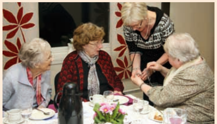
LØYNDOMSFULLT SMYKKE: Damene studerar nøye, men på kva? Er det ein spesiell læsemekanisme, inngraveringa eller metallkvaliteten?