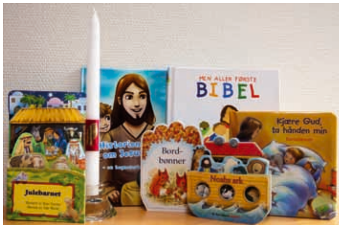
TROSOPPLÆRING I ÅSANE MENIGHET: Alle menighetens døpte i alderen 0-6 år har fått materiell og invitasjoner til aktiviteter i kirken.