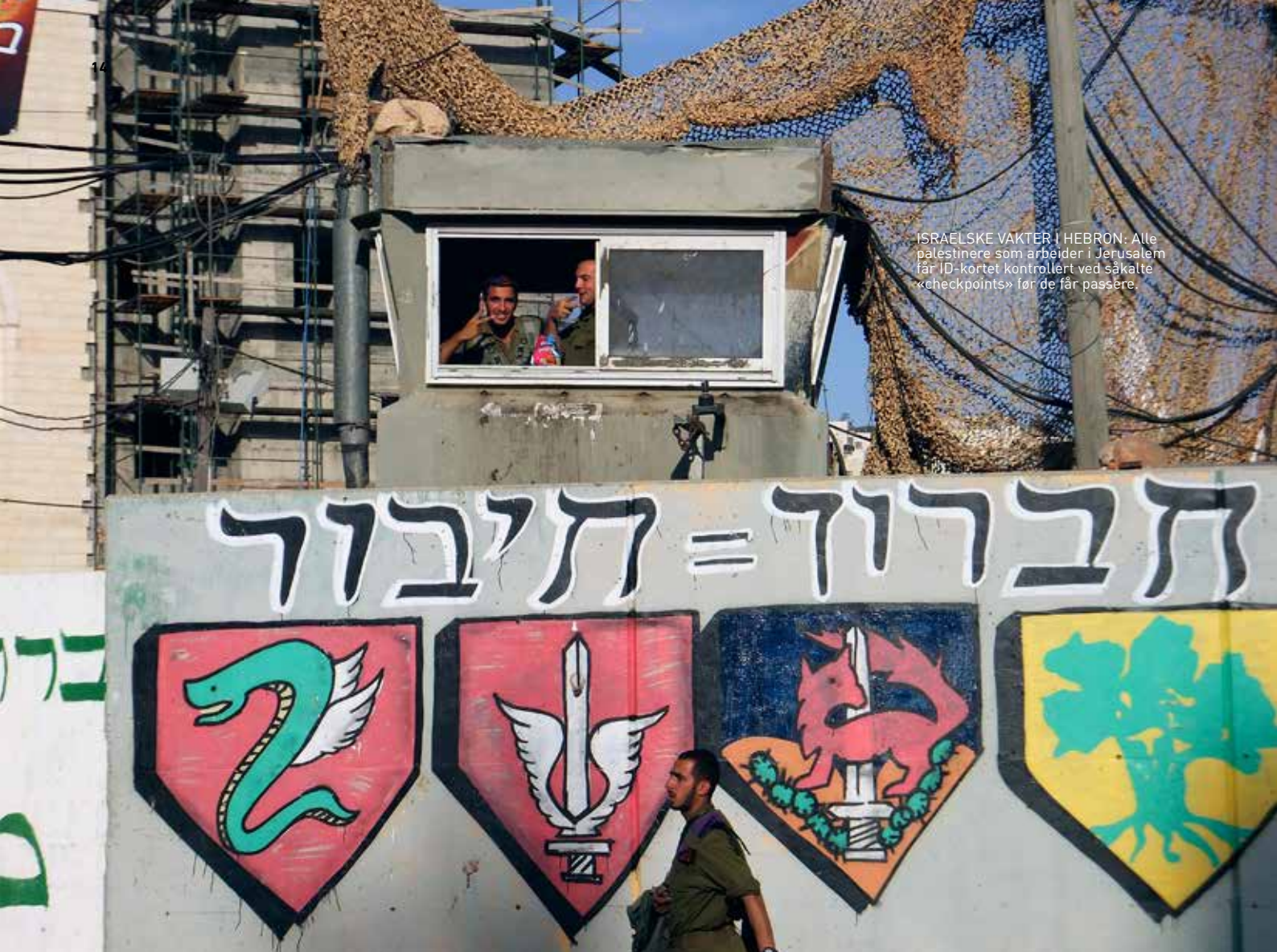
ISRAELSKES VAKTER I HEBRON: Alle palestinere som arbeider i Jerusalem får ID-kortet kontrollert ved såkalte «checkpoints» før de får passere.