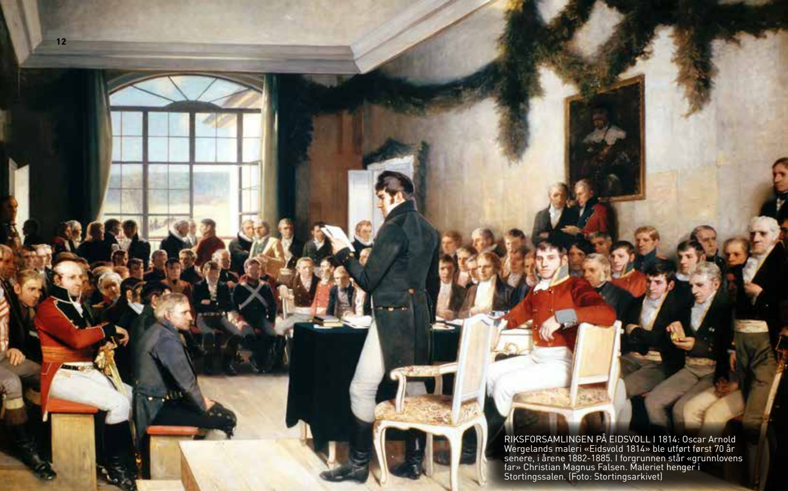
RIKSFORSAMLINGEN PÅ EIDSVOLL I 1814: Oscar Arnold Wergelands maleri «Eidsvoll 1814» ble utført først 70 år senere, i årene 1882-1885. I forgrunnen står «grunnlovens far» Christian Magnus Falsen. Maleriet henger i Stortingssalen.