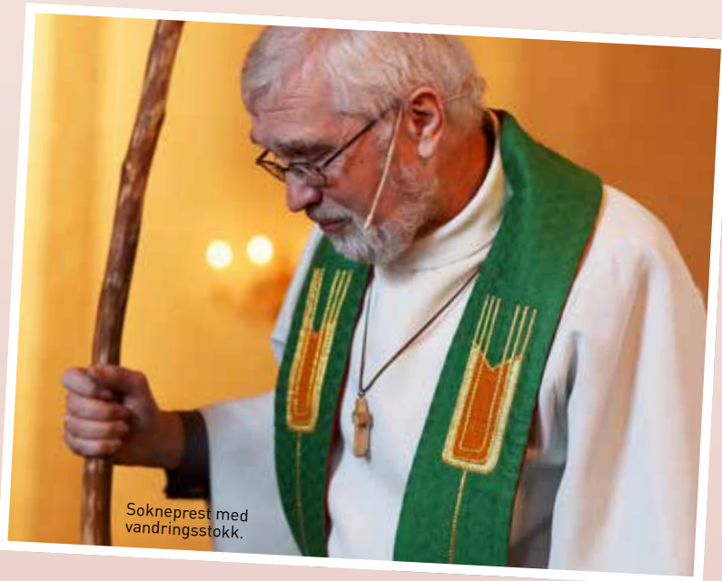
Sokneprest med vandringsstokk.