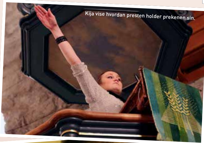
Kija vise hvordan presten holder prekenen sin.