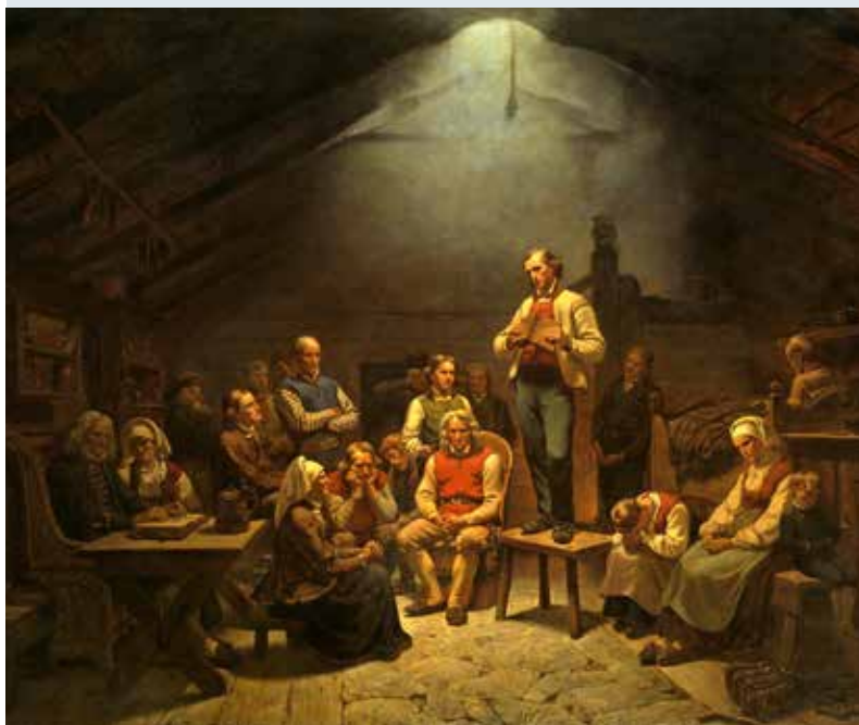
HAUGIANERNE: Den stående mannen midt i bildet er en lekpredikant tilknyttet haugianerne, en norsk kristen vekkellesbevegelse på begynnelsen av 1800-tallet. Adolph Tidemand arbeidet med motivet fra 1845 til 1852, og det finnes flere versjoner av bildet.

Den norske kirke ved Kirkerådet setter opp det nasjonalkirkelige utstillingsprosjektet «Tidemand og Gud» fra juni. Prosjektet er en vandretstilling som vil vises frem flere steder i perioden juni til september.