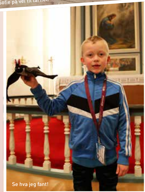
Se hva jeg fant!