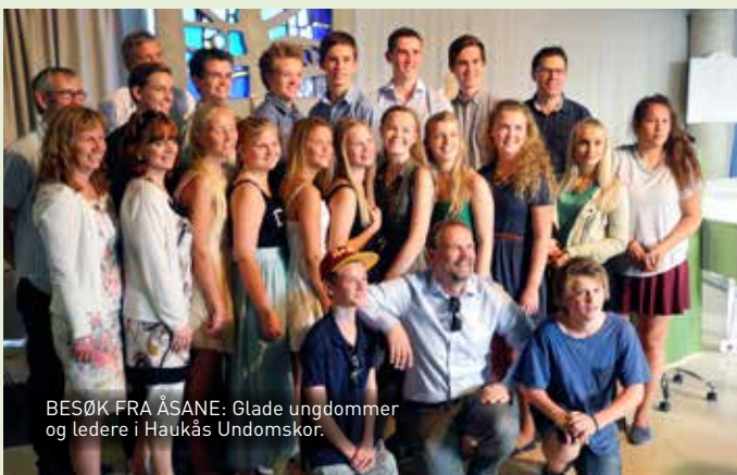
BESØK FRA ÅSANE: Glade ungdommer og ledere i Haukås Ungdomskor.