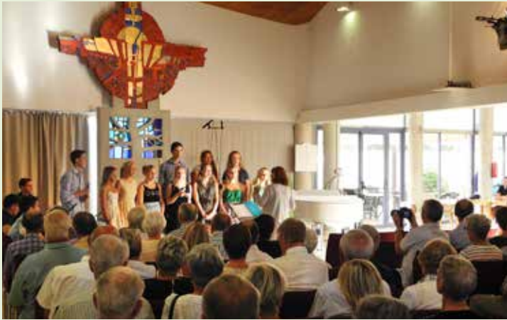
LOVSANG I SJØMANNSKIRKEN: Frisk lovsang og glade rytmer fra Haukås Ungdomskor i den vakre kirken i Torrevieja.

Det kan ikke akkurat sies at det mangler liv i denne kirken. Tilbudet til brukerne er ganske mangfoldig, med kulturkvelder, turgrupper, arbeidsgrupper, kor, ungdomsarbeid, kafeteria og gudstjenester.