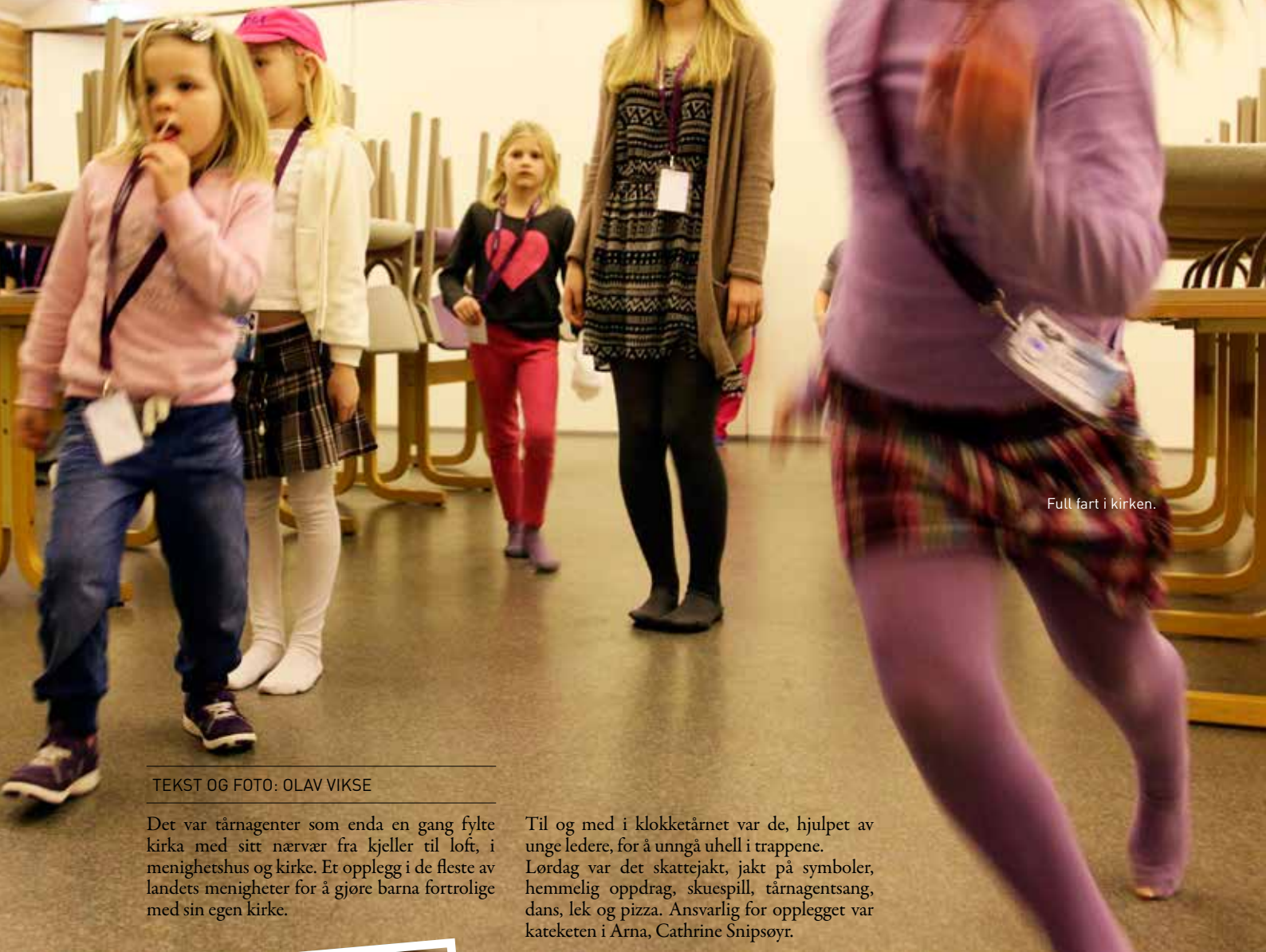
Full fart i kirken.

Det må nok sies at det også denne gangen var noen eldre damer som rynket brynene på søndag 19. januar da de kom til kirka og møtte et løpende mylder av åtteåringer som lekte sisten mellom benkeradene. «Slikt var ikke lov da jeg var ung!»