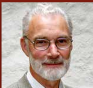
– Jubileumsboka vert ei perle Side 2-3

Løva Lenny ynskjer deg velkomen til kyrkjejubileum!