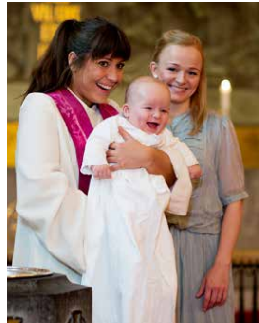
INN- OG UTMELDING: Vegen inn i kyrkja går gjennom vatn og dåp. Utmelding skjer på papir og med namnetrekk.

Kirkerådet kan ikke effektivere utmeldinger av Den norske kirke på grunnlag av epost-henvendelser folk genererer via nettstedet utmelding.no.