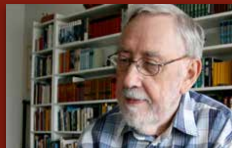
Omset Péturssons salmar Side 6