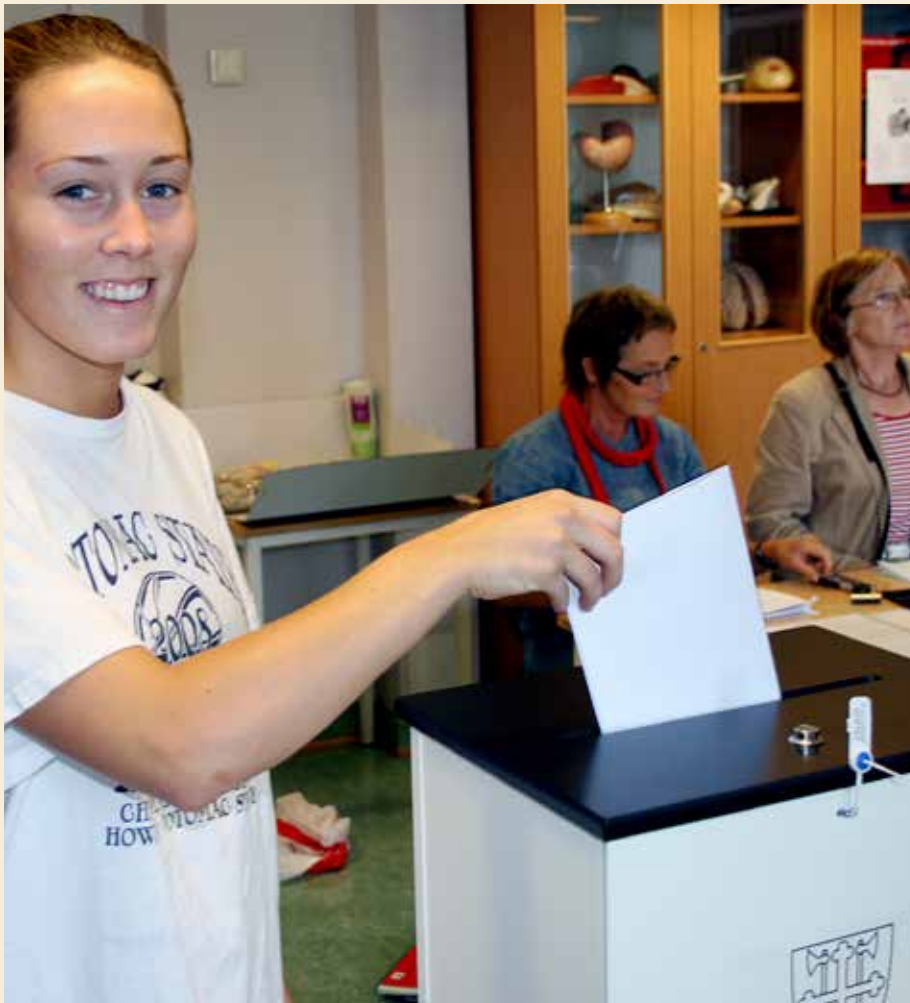
TRENG ENGASJERTE MEDLEMER: Den norske kyrkja skal gjennom viktige vegvalg i den komande valgperioden (2016-2019).

Samstundes med kommunevalet i september, skal det veljast nytt sokneråd og nytt bispedømeråd/kyrkjemøtet. Du kan vera med og avgjera korleis kyrkja skal styrast dei neste fire åra – både lokalt og nasjonalt.