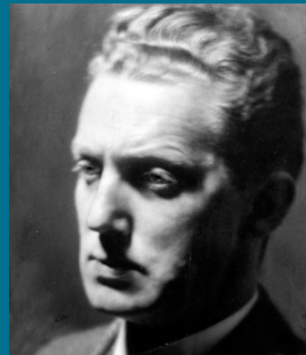
Trygve Gulbranssen, 1920