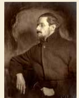
James Joyce i Zürich, 1918.

Det var som om sjelen hans mistet pusten et øyeblikk, mens han hørte hvordan snøen falt umerkelig gjennom universet, umerkelig som nedstigningen mot deres siste slutt, ned mot alle levende og de døde.