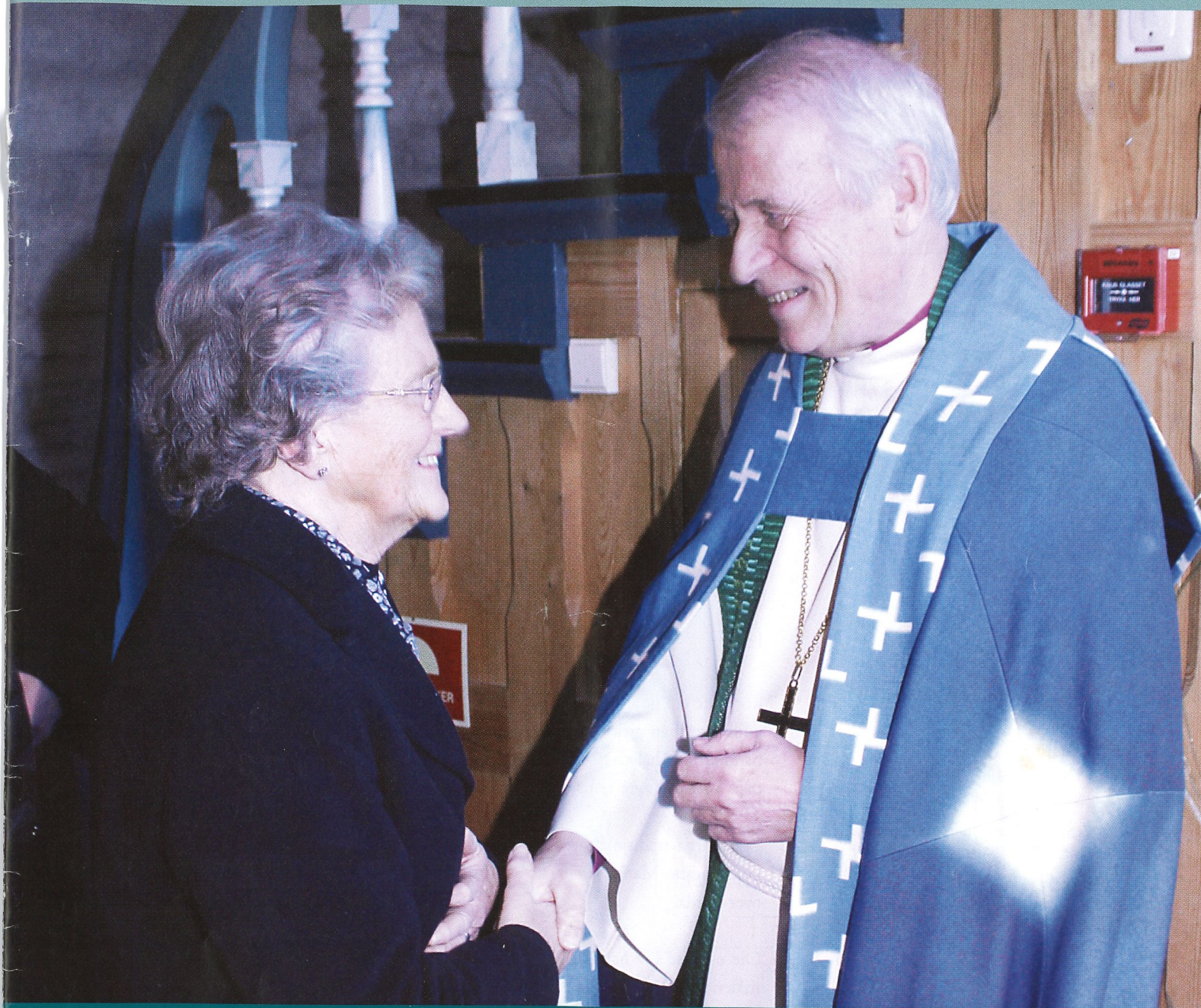
Avskilsgudsteneste for biskop Ole D. Hagesæter (SE SIDE 2 OG 3)