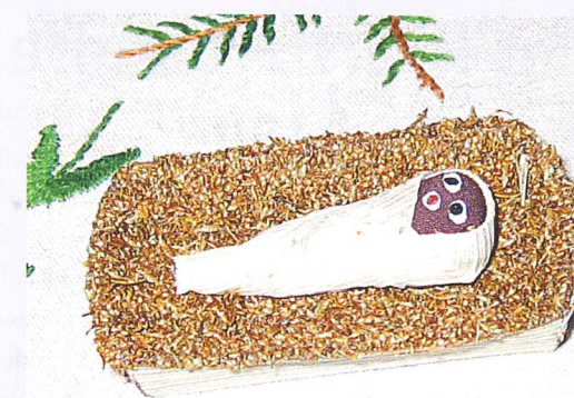
Krybben i Betlehem, i afrikansk utforming.

Gud den allmektige kunne nok sørget for at datidens hotell hadde ledig plass, at en lege tilfeldigvis bodde på samme hotellet; i det hele tatt at omstendighetene var optimale. Eller kanskje Gud skulle valgt vår tid, 2008, for å sikre sin eneste sønn en trygg, pedagogisk oppvekst med barneforsikring og hjelm? Vel, vel, vi har ofte en snever tanke om Guds allmakt. At den skal brukes til å gjøre alt så superdupert enkelt og lettvint. Men vår tanke er begrenset av tid og rom og preget av våre referanserammer.