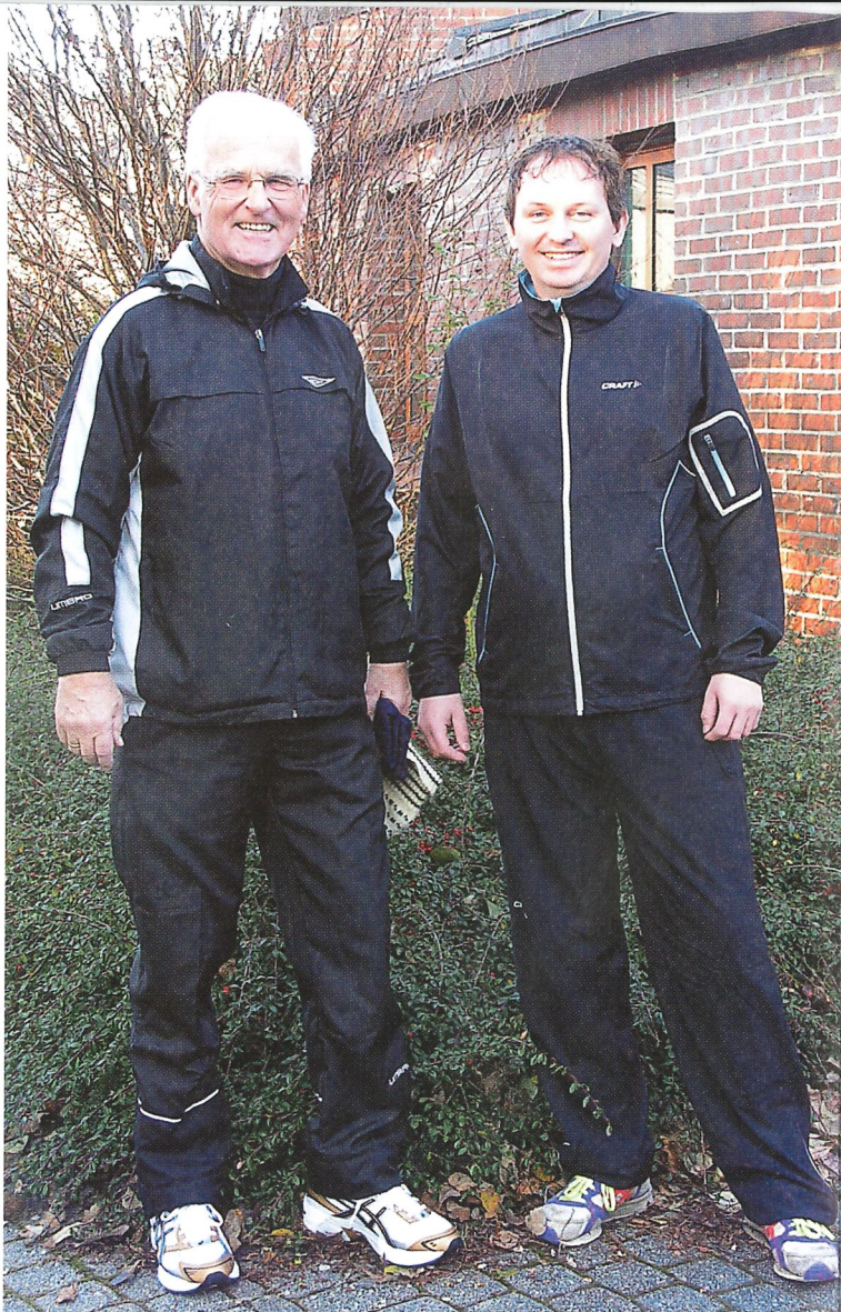
"Fit for figh: Prest og kirketjener klar for rundtur gjennom Åsane.

Første oppdrag var her å være med å bære 3000 stoler i Bergenshallen under TenåringsTreff (TT) i 1972.