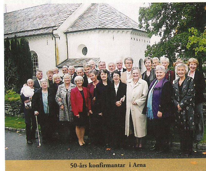
50-års konfirmantar i Arna