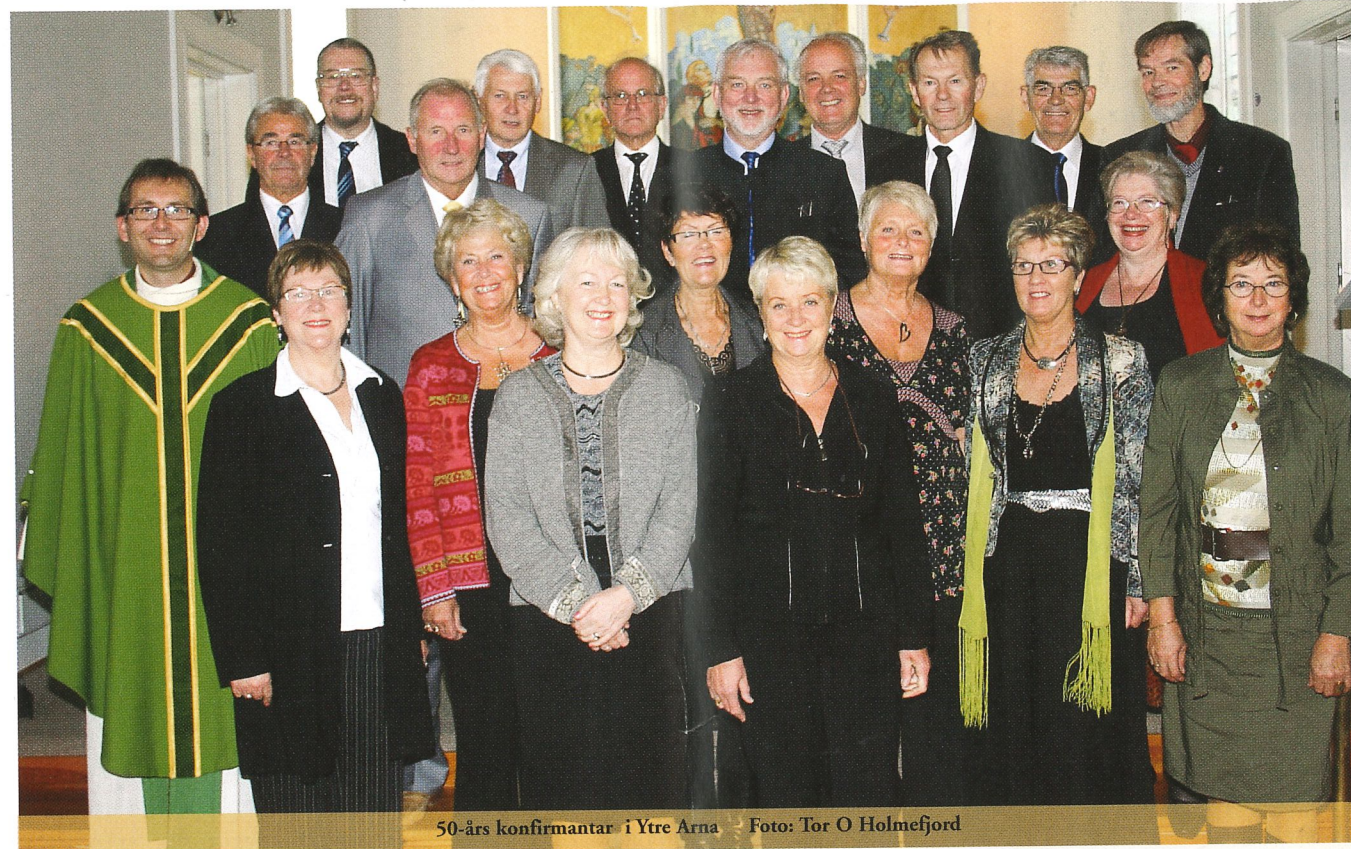
50-års konfirmantar i Ytre Arna