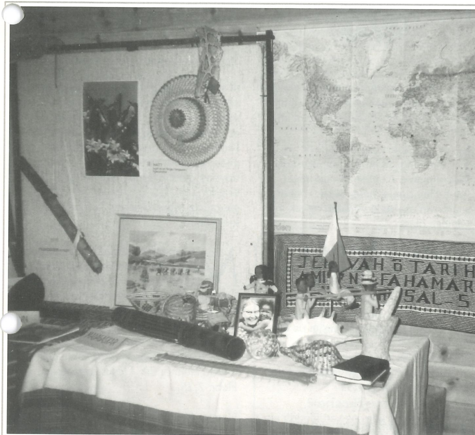
Frå misjonsutstillinga i Arna kyrkjelydshus under Kulturdagane i Arna 20.-25. april 1999.