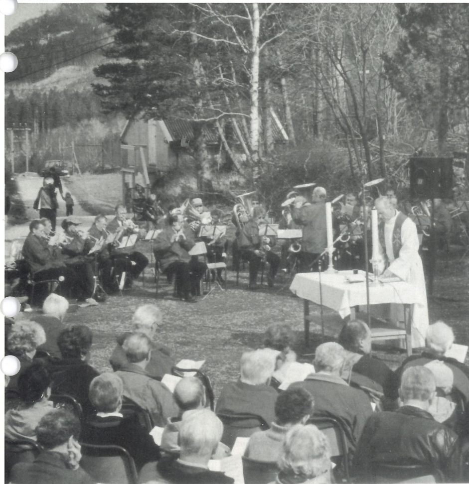
Frå friluftsgudstenesta i fangeleiren på Espeland 9. april, der prost Kjell Nese gjorde teneste.