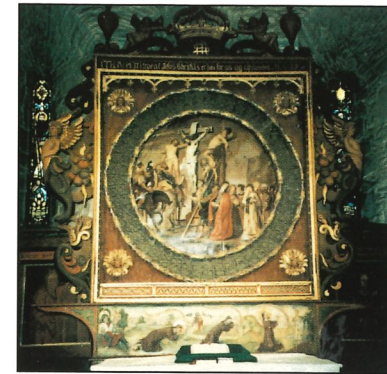
Altertavla i Vangskyrkja