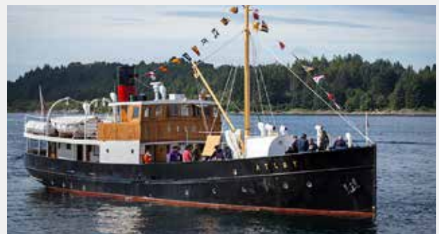
FOLKEFEST MED VETERANBÅTAR: MS Atløy, som her siglar inn på havna i Florø under Fjordsteam 2015, kjem til Bergen under Kystsogevekene.

For dei som vil vere med på ein av båtane, vil det kome informasjon om kor ein får kjøpt billettar. Følg med på www.kystsogevekene.no .