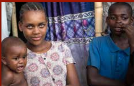
Fasteaksjonen bergar liv! Side 12