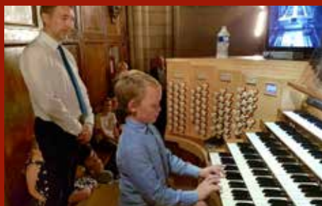
Lærer opp framtidens organistar Side 9