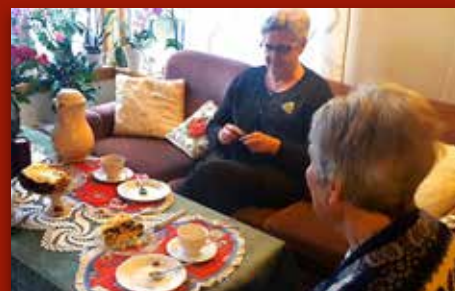
Hjartebanken på heimebesøk Side 4