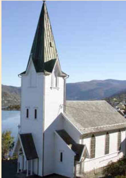
Ytre Arna kyrkje