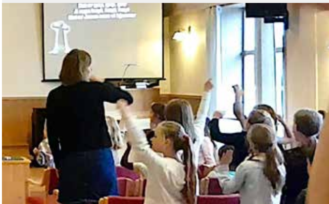
Frå ein Ving kveld

På Ving har me det veldig kjekt med ulike aktivitetar. Ein vanleg Ving byrjar med ein møtedel med song og andakt. Denne delen er svært viktig, og mange barn får her for første gong høyre bodskapan om Jesus som frelsar og ven. Dei får òg kjennskap til dei viktigaste bibelhistoriene frå GT.