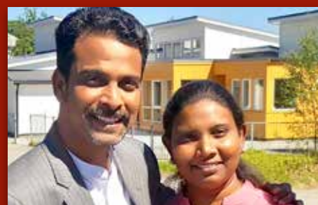
Besøk frå Bangladesh