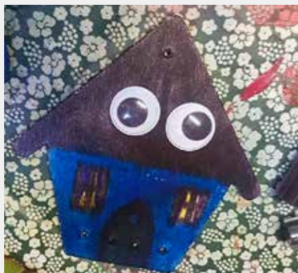
Kunst laga på Ving.

For aldersgruppa frå 5. klasse og oppover finst Fredagsklubben på Ytre Arna bedehus. Dei samlast annakvar fredag kl. 18.00-20.30. Ungdomsklubben på Haugland bedehus samlast annakvar søndag kl. 18.30.