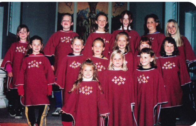
Ytre Arna barne- og ungdomskor 1999

Frå starten var det to gudstener i månaden i Arne kapell, som kyrkja heitte då. Seinare var det i mange år minst tre. Tidleg på 2000-talet kom talet ned att på to. Ein grunn kan ha vore at prestane no skulle ha ei frihelg i månaden. Gudstenestespråket var riksmål/bokmål fram til 1937, då det vart vedteke å gå over til nynorsk. I 1907 tok ein til å bruka Blix-salmane attåt Landstad, frå 1936 til Norsk Salmebok kom i 1984, nytta kyrkjelyden Nynorsk Salmebok.