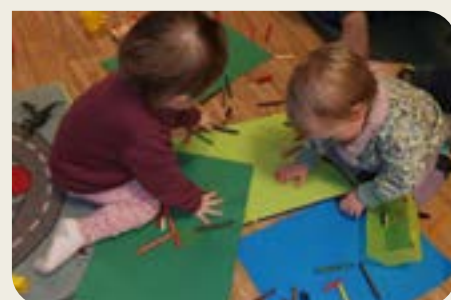
Open barnehage er kjekt for både born og vaksne.

Ytre Arna kyrkjelydshus Tirs., ons., tors., kl 9-14.30