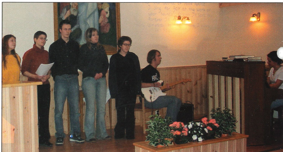
Besøk fra Kongshaug Musikkgymnas.