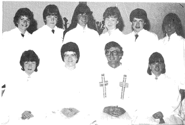
Konfirmasjon Trengereid 1982.

Frå sola stig og strålar i svale morgonvind og til ho atter målar sin avdagseld på tind, Gud Fader retter hender utover jorda all, og full av miskunn sender han oss sitt nådekall.