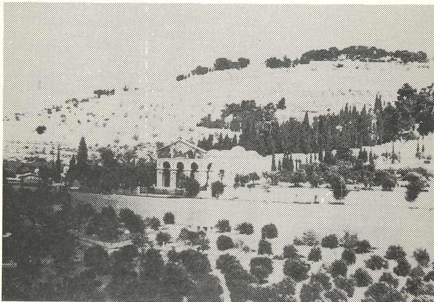
Kedrondalen og Getsemanehagen. I Getsemanehagen er bygt ei kyrkje, Alle nasjoners kyrkje. Det er gjort for å visa at Jesu lidning og død gjeld for alle menneske.

Det vert kyrkjelydstur for Arna og Ytre Arna sokn til Israel i oktober. Turen vil vara 15 dagar, og vi vil få sjå alle dei bibelske stadane i landet ved sidan av at vi får oppleva det