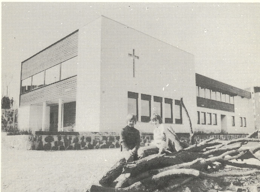
Mjølkeråen bedehus er eit av dei nye og moderne gudshus i Nordhordland.

Årsmøte og jubileum på Frekhaug 10. og 11. juni