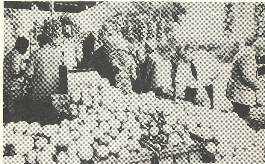
I Jeriko kan ein kjøpa appelsinar nesten direkte frå trea. Her er det ei norsk gruppe som tek føre seg av fruktene.

Vi har store forventningar til denne Israel-turen. Vi ser det som verdfullt at mange i kyrkjelyden kan få høve til å oppleva det