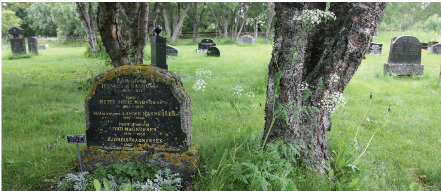
Øverst: fra perioden fram til ca.1930. Nederst: fra perioden 1930 - 1956. Begge bildene er fra kvartal 27-52.