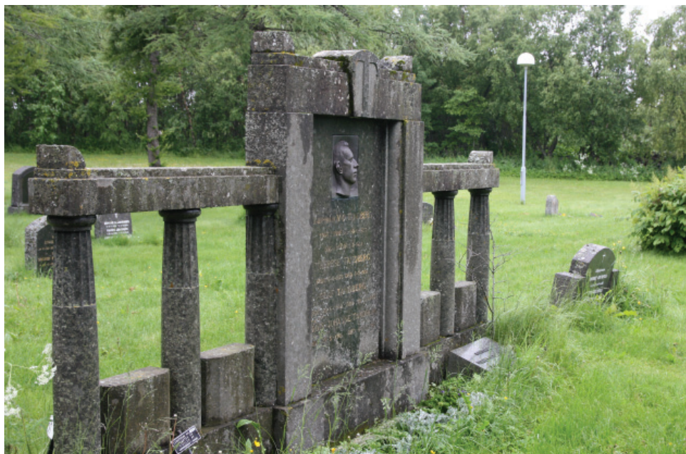
Unikt gravminne som foreslås vernet på kvartal 54-65.

Gravminnene måles inn digitalt som grunnlag for utarbeidelse av ny gravplan og ny landskapsplan.