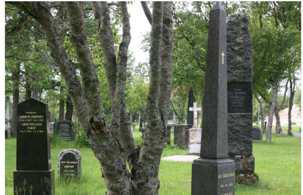
Samspill mellom trær og gravminner.