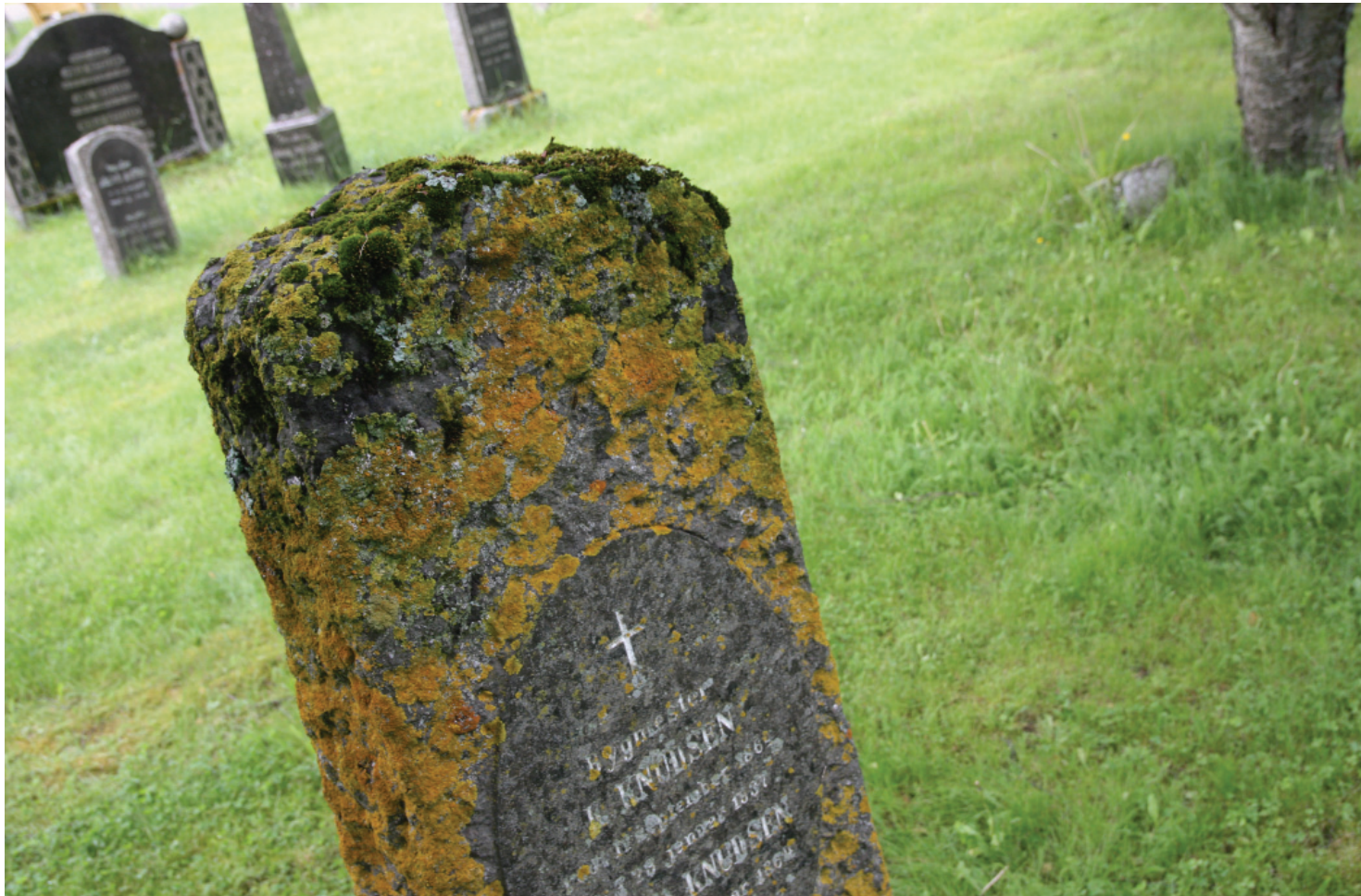
Eksempel på gravminne hvor mose bør fjernes fra toppen og hvor skriflatten bør holdes fri for lav.