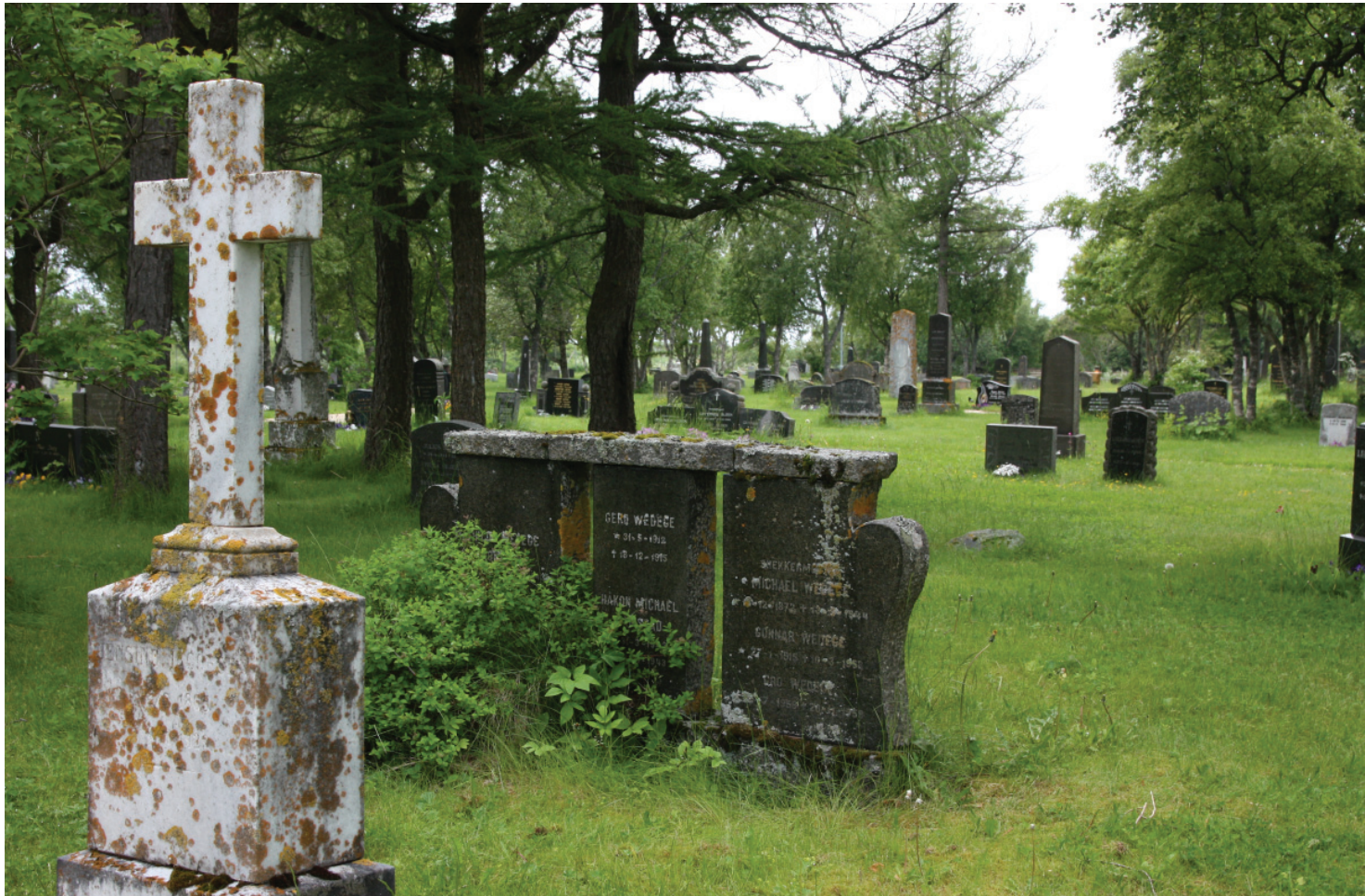
Gravminnene på kvartal 54-65 27-52 har stor variasjon.