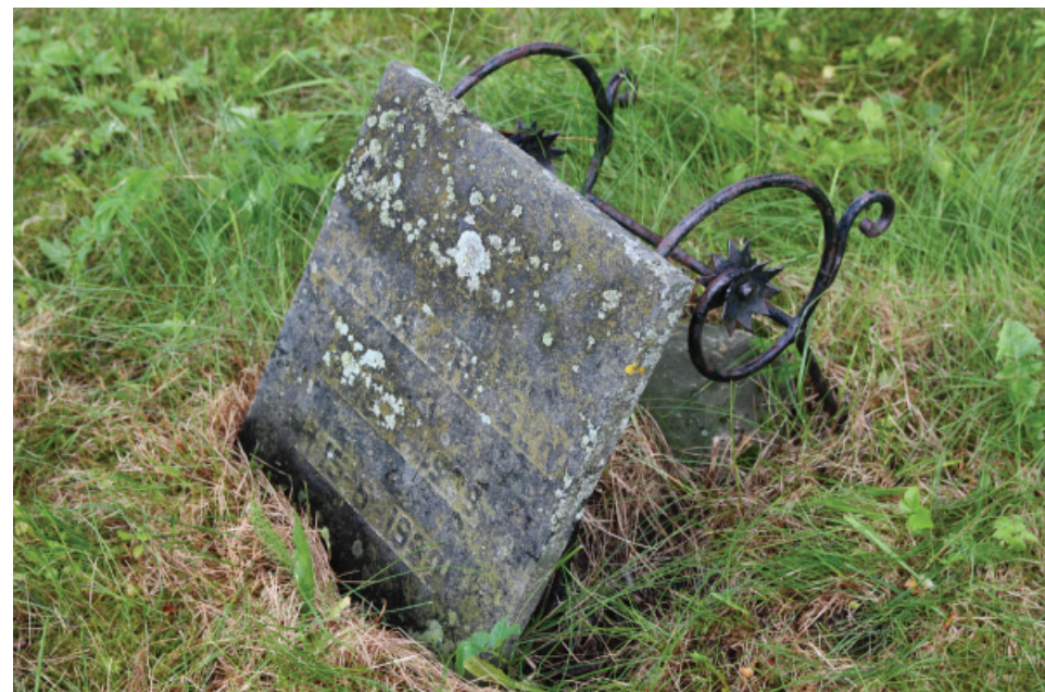
Unikt gravminne som foreslås vernet på kvartal 1-26.