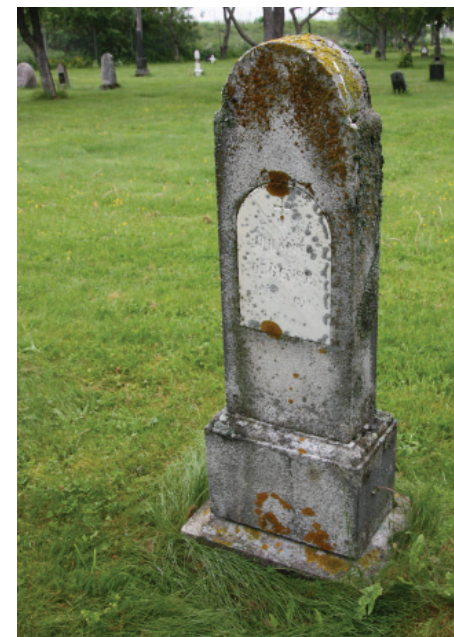
Unike gravminner som foreslås vernet på kvartal 1-26.