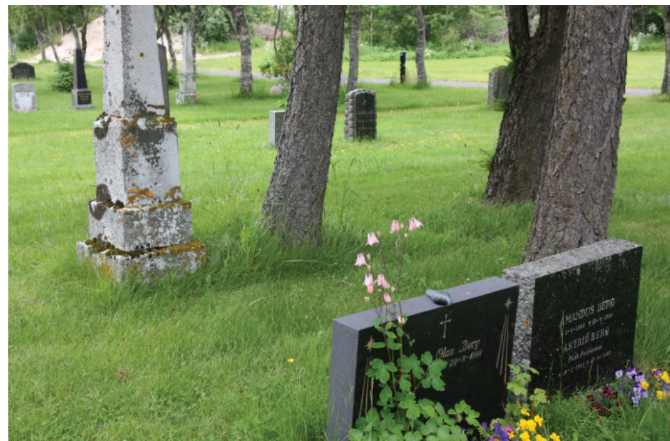
Eksempel på gravminner som er enkle, lave og rektangulære.

Ny bruk av gravkvartalet med urnenedsettelse vil kunne stimulere til økt besøk i det bevarte området.