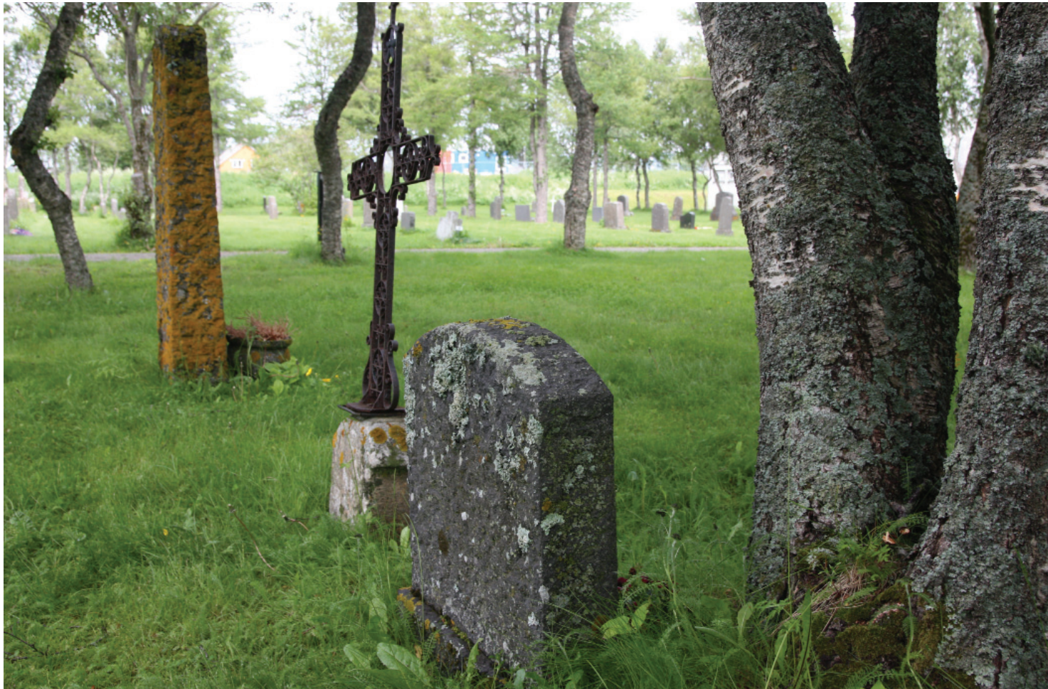
Vegetasjon og gravminner danner til sammen et helhetlig gravmiljø.