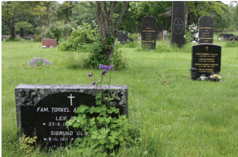
Akeleie som svever over gravminnet.

I kvartal 27-52 er det rester av akeleier som har sådd seg tilfeldig omkring. Akeleier kan en se rester av på mange gravplasser i Nordland. Antagelig har dette vært en plante som har vært mye brukt tilbake i tid. Ved de bevarte gravminnene vil det ikke komme noen å plante blomster til minne om den døde. For å tilbakeføre noe av den frodige stemningen som det tidligere var her, foreslås det at det plantes akeleier omkring trær og andre steder hvor det er mindre tråkk. Det er også mulig å så akeleier i bakkant av gravminnene slik at en fremdeles kan lese navneinskrripsjonene. På Alstahaug kirkegård i Nordland kan en se dette gjort. Blomstene på de lange bare stilkene svever over gravminnene og danner et helhetlig blomstrende uttrykk.