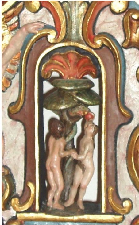
Adam & Eva

Adam og Eva står rundt treet som de ikke fikk spise av. I treet ser vi slangen som fristet dem. Adam og Eva er symbol på menneskets opprør mot Gud. 1 Mos 3:1-7: Slangen var listigere enn alle ville dyr som Herren Gud hadde skapt. Den sa til kvinnen: "Har Gud virkelig sagt at dere ikke skal spise av noe tre i hagen?" [2] Kvinnen svarte slangen: "Vi kan godt spise av frukten på trærne i hagen. [3] Bare om frukten på det treet som står midt i hagen, har Gud sagt: Den må dere ikke spise av og ikke røre; ellers skal dere dø!" [4] Da sa slangen til kvinnen: "Dere kommer slett ikke til å dø! [5] Men Gud vet at den dagen dere spiser av frukten, vil deres øyne bli åpnet; dere vil bli som Gud og kjenne godt og ondt." [6] Nå fikk kvinnen se at treet var godt å spise av og herlig å se på et prektig tre, siden det kunne gi forstand. Så tok hun av frukten og spiste. Hun gav også mannen sin, som var med henne, og han spiste. [7] Da ble deres øyne åpnet, og de merket at de var nakne. Så flettet de sammen fikenblad og bandt dem om livet.