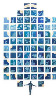
Altertavlen er laget av Tor Lindrupsen.

Gudstjenesten er ukens felles møtepunktet for alt menighetens arbeid, og sentrum i vår virksomhet. Hunstad kirke har et flott kirkerom som omslutter folk på en god måte når de kommer inn. Det er lav terskel og høyt under taket, og gir rom for varierte uttrykk. Altertavlen med de 80 enkeltbildene og Kristusfiguren i sentrum ønsker oss velkommen inn til gudstjeneste med dåp og nattverd i den oppstandnes navn, lovsang og velsignelse.