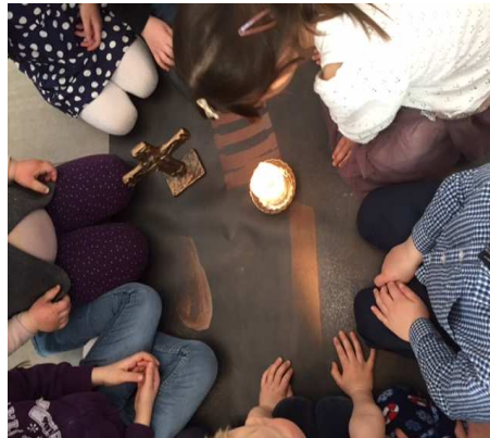
I kirken samles barn, unge, voksne og eldre. Her sitter en gruppe barn rundt sterke symboler: Korset og