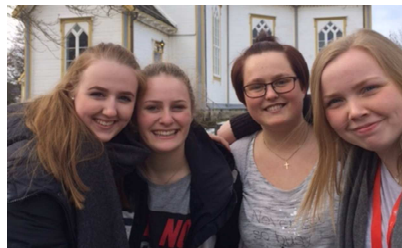
Ungdomsledere er viktige medarbeidere.

Det handler ikke om å stille krav til mennesker i menigheten, men om å se oss som et fellesskap som får ting til sammen. Det er ikke de ansatte som løser oppgavene, eller de frivillige som gjør noe for de andre i menigheten. Det er ikke noe vi og de . Alt vi gjør, står vi sammen om.