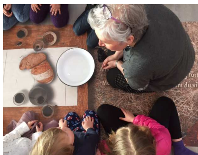
Påskeduken i aktiv bruk.

Trosopplæringsarbeidet i Hunstad kirke preges av mye kreativitet. Det jobbes for eksempel med en rekke ulike metoder for formidling