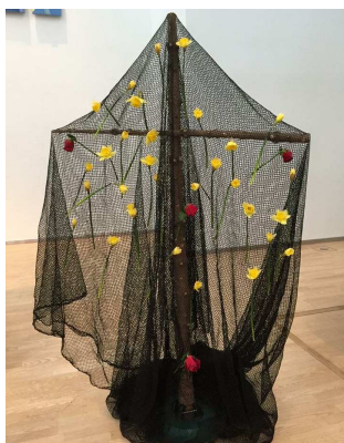
Korset kledd med sørgeslør og påskeliljer.

Fellesskapet rundt gudstjenesten er viktig, og derfor er det alltid kirkekaffe i forlengelse av gudstjenesten.