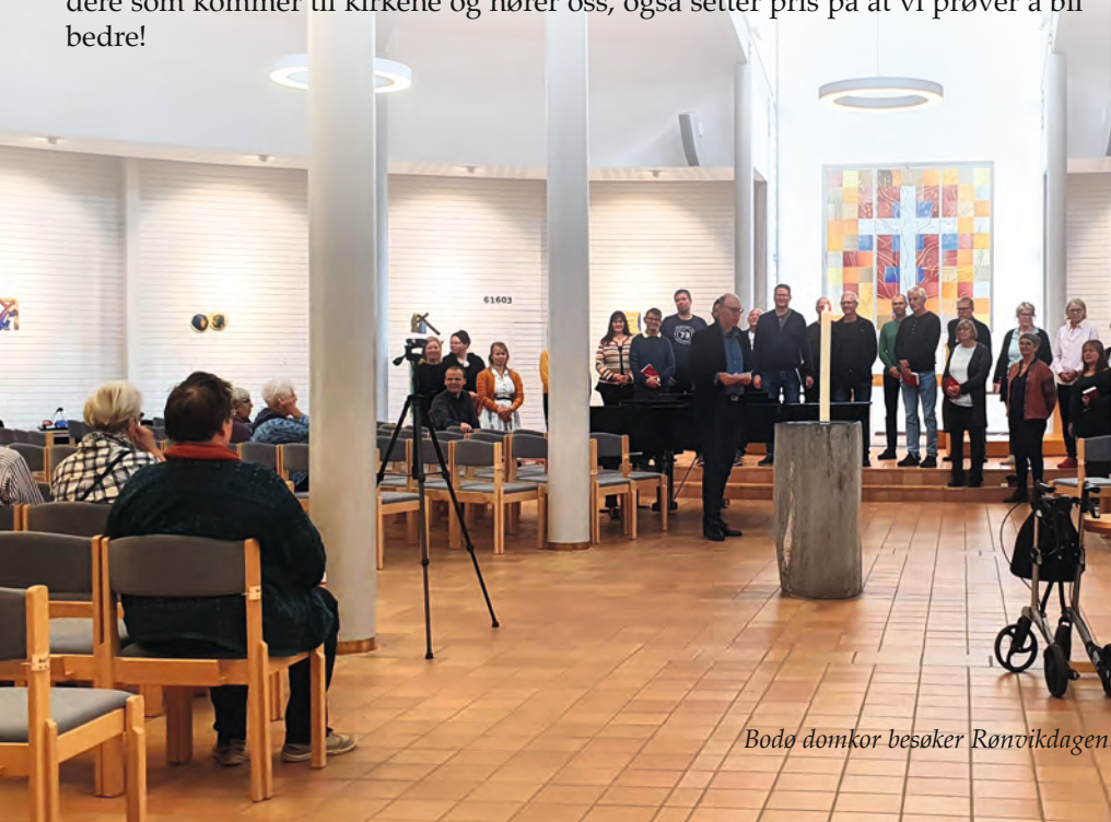
Bodø domkor besøker Rønvikdagen.

Målet med dette studieopplegget er naturligvis at vi skal fortette å utvikle oss som predikanter, gjennom å hjelpe hverandre til å se egne prekener med et nytt blikk. Ingen er utlært, og min erfaring er at det er morsomt å jobbe med eget fag og kjenne at man kan utvikle seg. Dessuten kan det jo også skje at alle dere som kommer til kirkene og hører oss, også setter pris på at vi prøver å bli bedre!