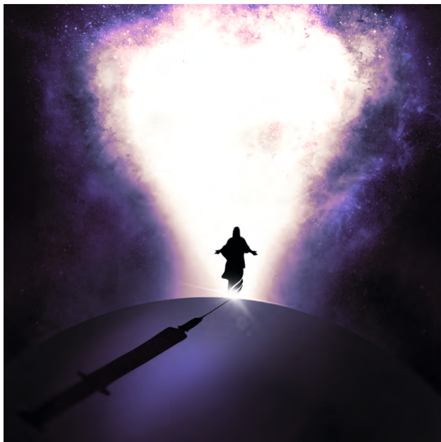
ill. Johan Reisang