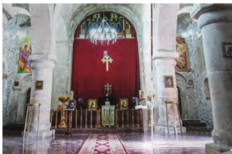
Kirkeskipet er vakker utført i stein!

Rønvik menighet inngikk i 2001 en samarbeidsavtale med Normisjon om et misjonsprosjekt i Aserbajdsjan. Mange kirker i verden trenger støtte, så Rønvik menighet har nå avsluttet dette prosjektet til fordel for nye prosjekter (i Egypt og Kamerun).