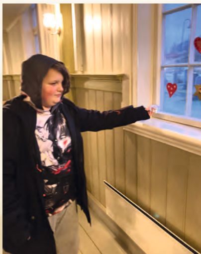
Brage pynter vindusrutene