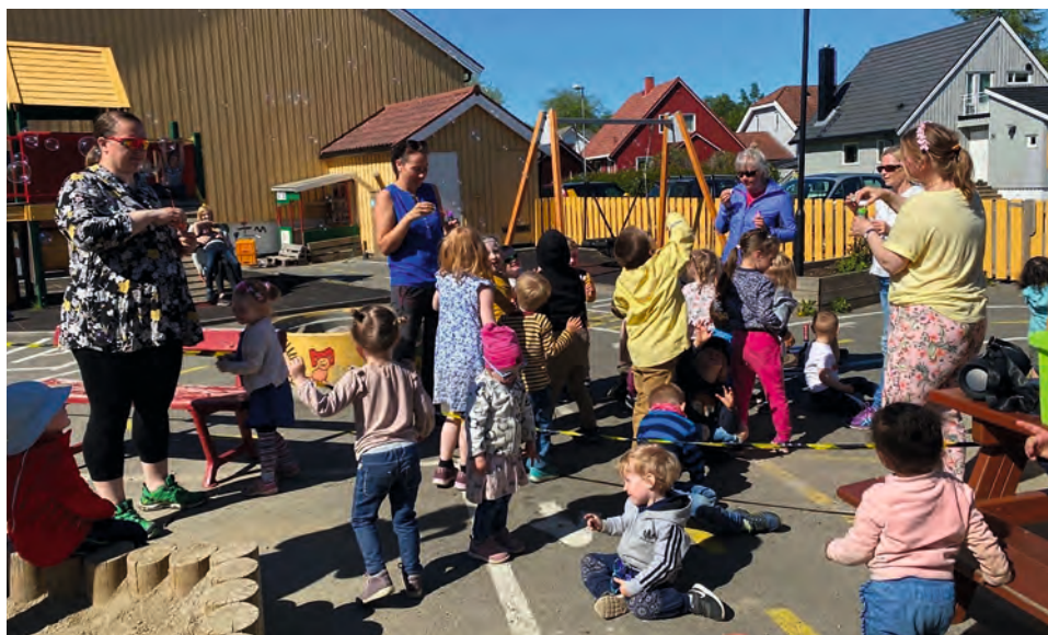
Sommer og lek i barnehagen.

har vært en klippe i hverdagen for oss de siste 5 årene. Vi setter enormt pris på at det er så trygge og dyktige voksne som har masse omsorg for barna. I tillegg synes vi det er positivt at det er en liten og oversiktlig barnehage. Lokalene er relativt nye og ligger nært flere av turområdene i Rønvik. Med andre ord er det et flott sted å leke, lære, å utvikle seg, og å få en god ballast videre i livet.