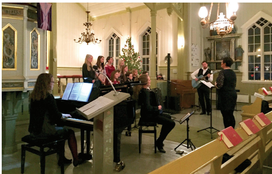
Stemningsfull konsert i Kjerringøy med fornøyd publikum.