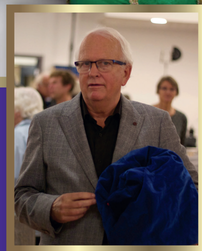
Mannen bak «Tenn lys» s 4.