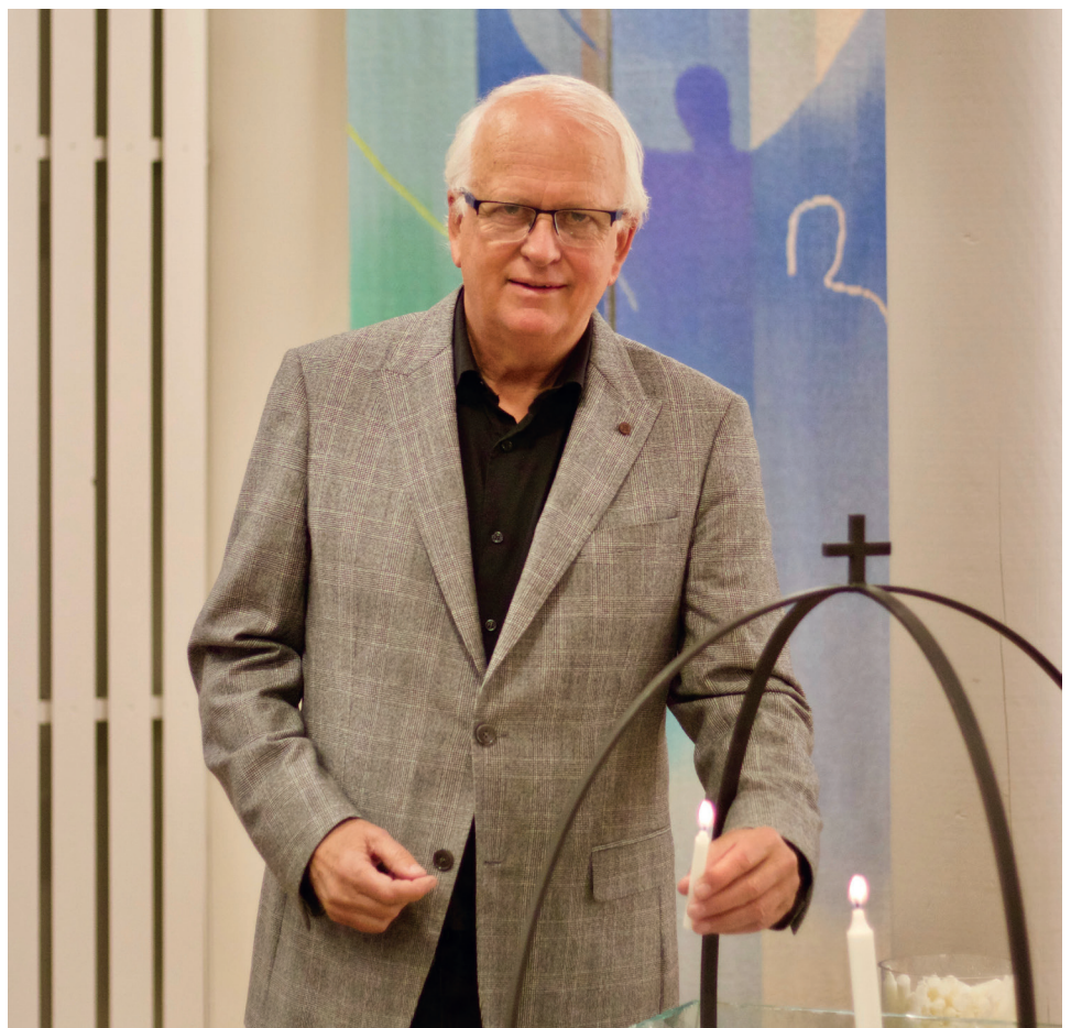
Eyvind Skeie tente lys i Rønvik kirke da kirkespillet hans ble satt opp i høst. Han står bak Norges kanskje aller mest kjente førjuls-salme, som opprinnelig ble skrevet for Barne-TV.

I bunnen er han prest, og han startet yrkeslivet som kapellan i Tromsø og i Kirkens bymisjon før han ble frilans forfatter. Salmer har han skrevet hele tida. Men det var som en av hovedforfatterne bak NRK-seriene «Portveien 2» og «Sesam stasjon» på 1980- og 1990-tallet at Eyvind Skeie virkelig skrev seg inn i de tusen hjem. Ingen av dem som var barn eller hadde barn på den tida har unngått Alfa, Max Mekker eller Jarl Golis svingende «Ta en potet!» Og som en del av denne TV-produksjonen ble også «Tenn et lys» skapt.