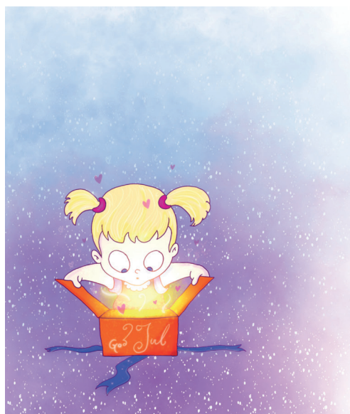
Illustrasjon: Jolhan Reising