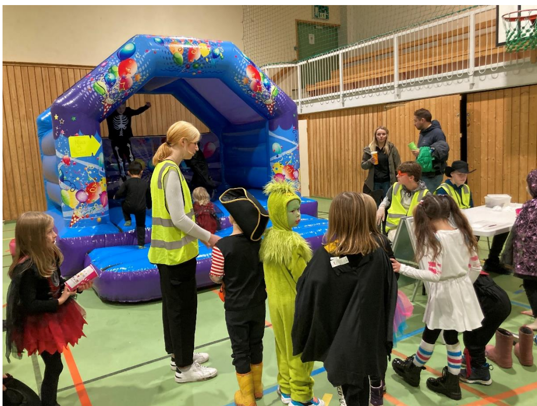
Fra HalloVenn i Tverlandshallen 31. oktober 22.