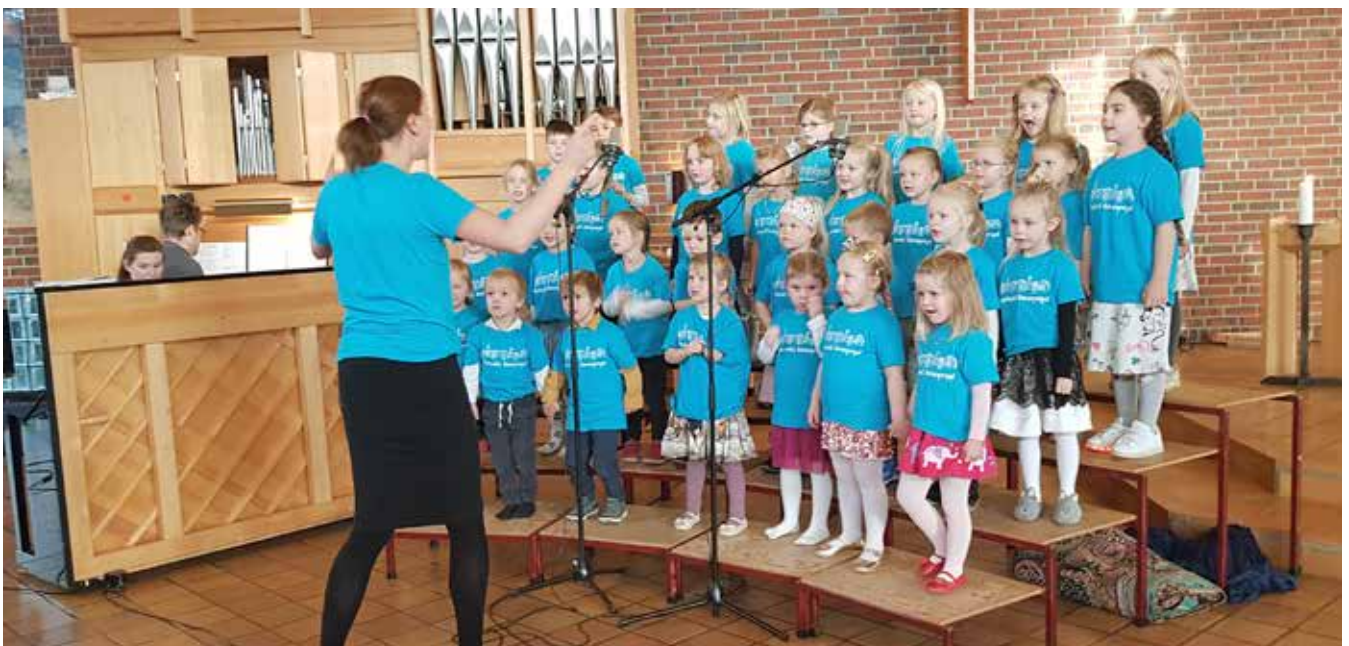
Tverlandet barnegospel.

Alle korene tar imot flere medlemmer, det er bare å komme på en øving og se hvordan vi har det.