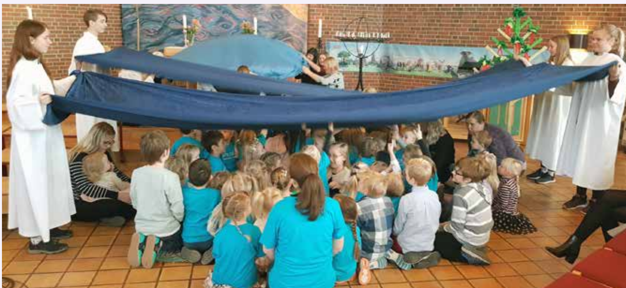
Tverlandet barnegospel sang, foreldre med barn fra Knøttetreff deltok, Babysang var med i sang og dans, 4-åring fikk sin 4-årsbok og konfirmanter hjalp til under bibeldramatiseringen.