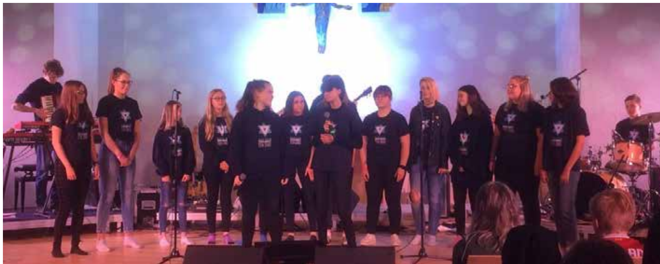
Tverlandet Ten-Sing opptre på Høstfestivalen.