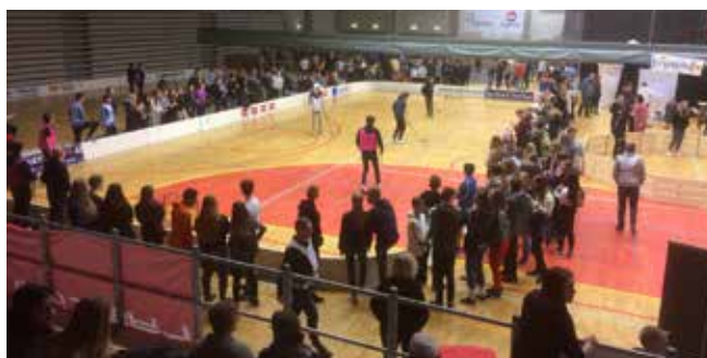
Innebandy på bynatt.