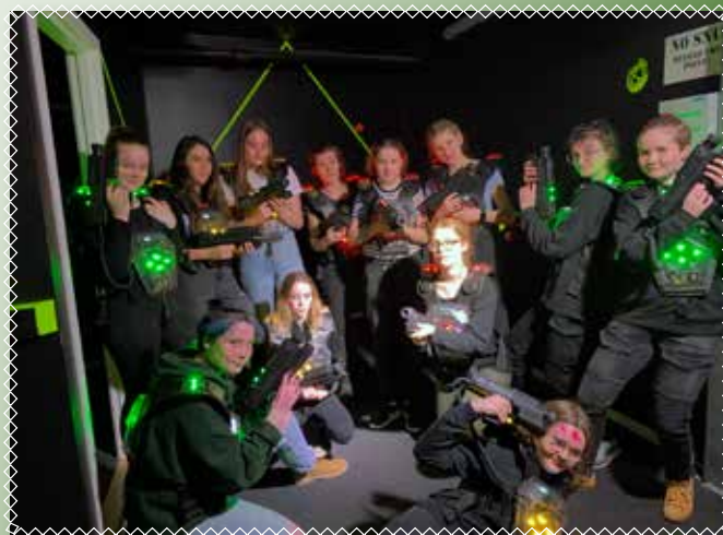
Laser tag 2020.