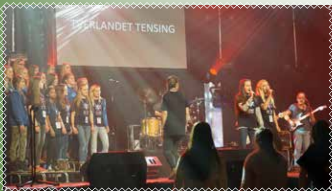
Opptreden på Bynatt 2016.