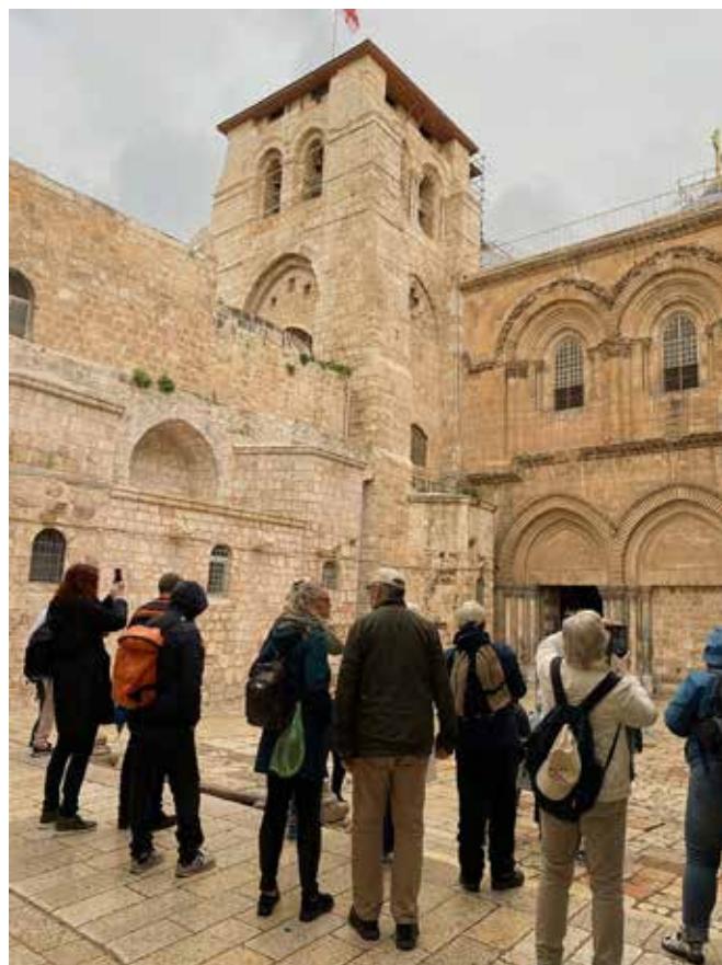
Gravkirken i Jerusalem.