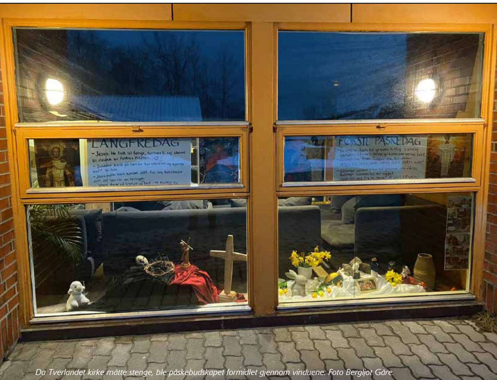
Da Tverlandet kirke måtte stenge, ble påskebudskapet formidlet gjennom vinduene.

Menighetsblad for Saltstraumen og Tverlandet