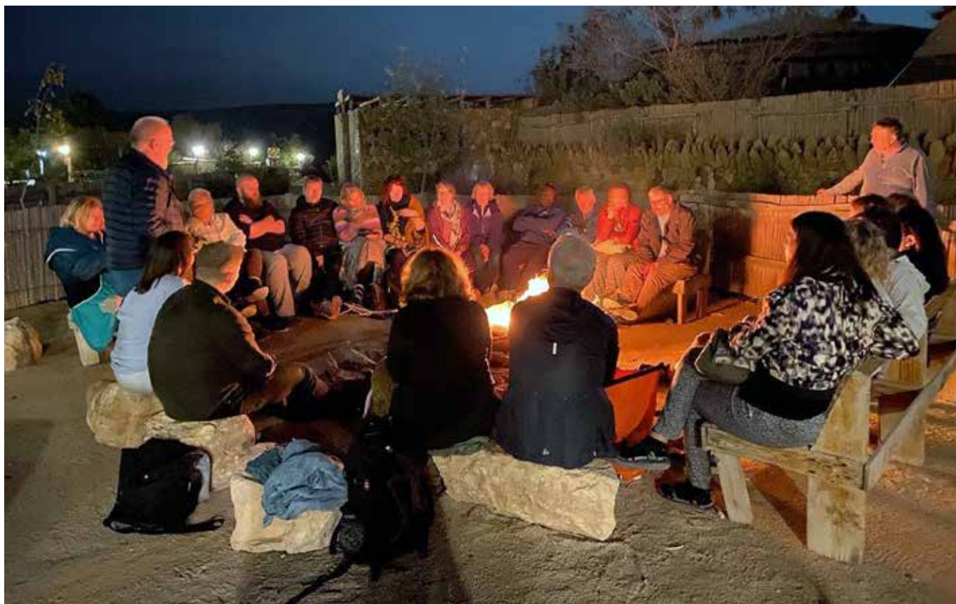
Samling rundt bålet.

mye om historie og nåtid i regionen. Vi fikk et innblikk i mangfoldet, konfliktene, utfordringene i dagliglivet, og ikke minst opplevde vi våren, frodighet, fargespill i natur og kunst og arkitektur.