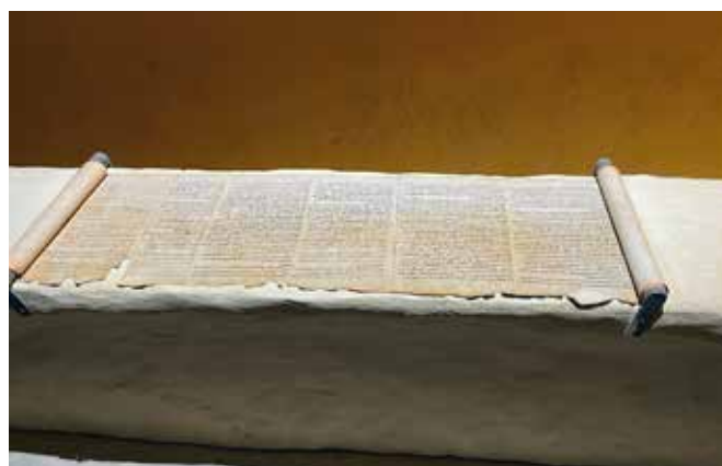
Skriftrullen med Jesaiasboka.

Takknemlig for reisen, alle disse inntrykkene, og takknemlig for at vi lever så godt i landet vårt med frihet og fred. Takknemlig for å følge i Mesterens spor.