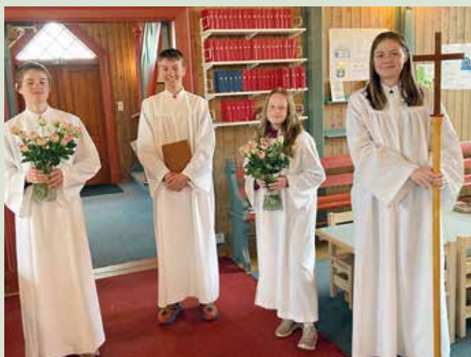
Konfirmanter klare til opptak.