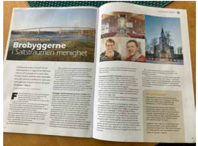
Faksimile fra bladet «Først».