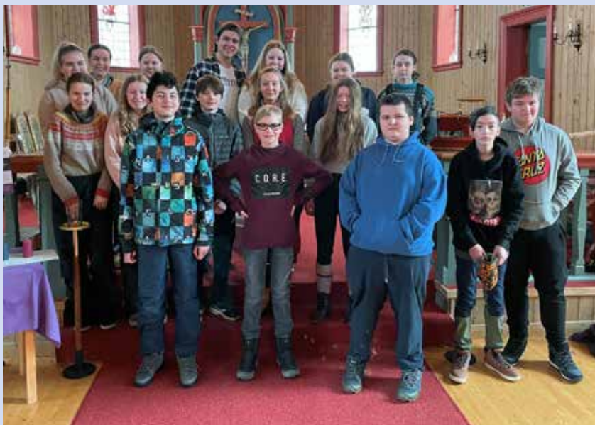
En gjeng blide konfirmanter.