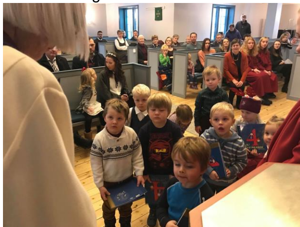
Lyttande 4-åringar i Dombås kyrkje