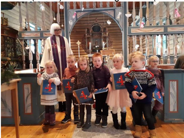
4-åringar i Dovre kyrkje