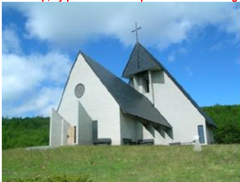
Eysteinkyrkja – 50-årsjubileum