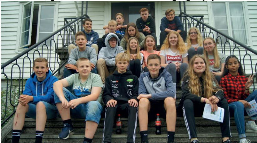
Konfirmantar-2020 frå Dovre på leir