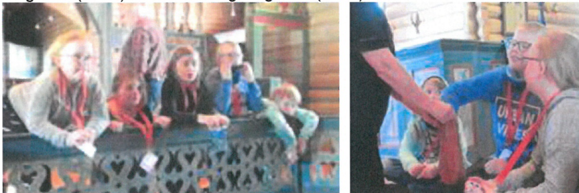
Tårnagenter løyer mysterier og oppdrag