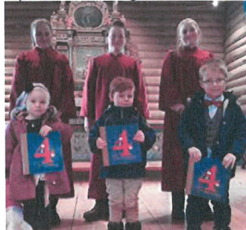
Tre firåringer og konfirmantar i Dovre