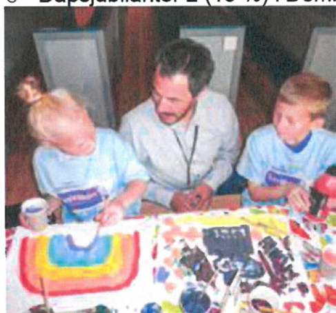
Tema: Å vere ein ven