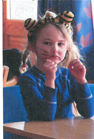
Karneval og kyrkjekaffe