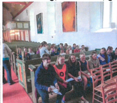
Samling i Vereide kyrkje