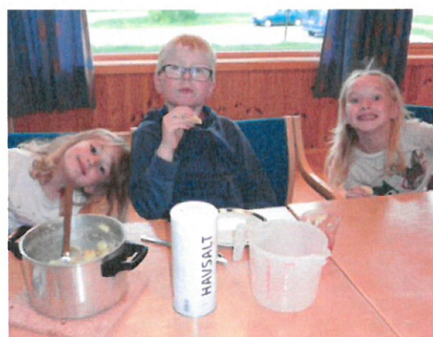
Velling, beta med poteter og kålrot smaker godt!