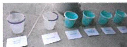
Korleis fordele 60 liter vatn for alle daglege behov...