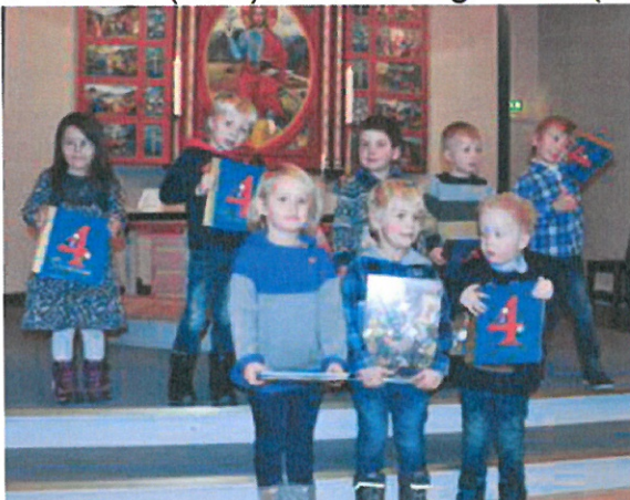
Atte fireåringer i Dombås