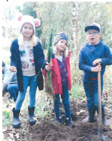
Potetopptaking på Dovre