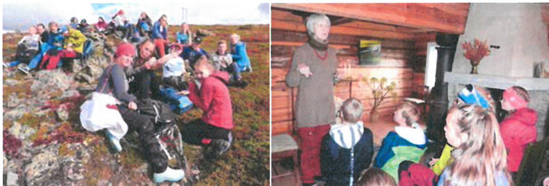
Perspektivtur 14.9 til Fokstugu og Guds Huset