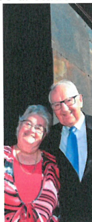
Initiativtaker og sponsorer