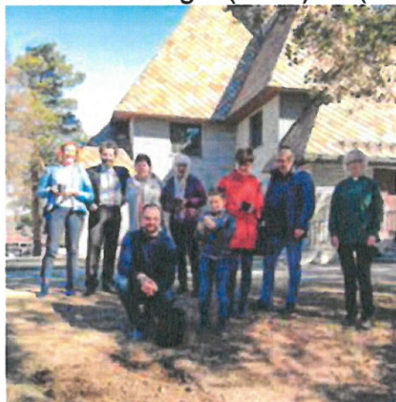
Såing på Dombås