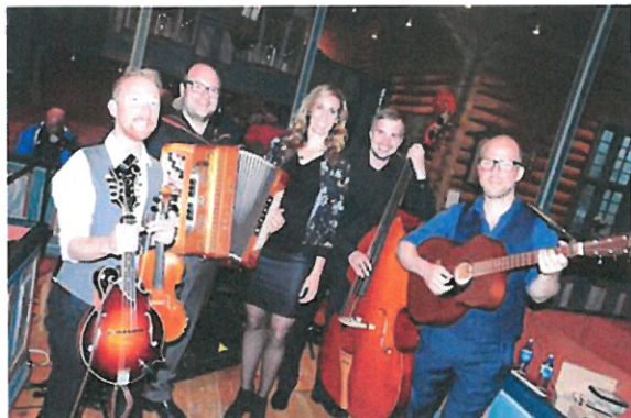
Sol i skuggeland i Dovre kyrkje

Dagsvandringar: Vollheim-Budsjord. Budsjord-Fokstugu. Fokstugu-Dovregubbens hall. Dovregubbens hall-Hjerkin. Arrangementer i Oppdal fram til 21. juli.