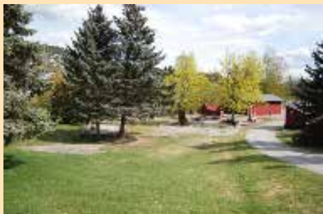
Parkområde i barnehagens gamle lekeplass