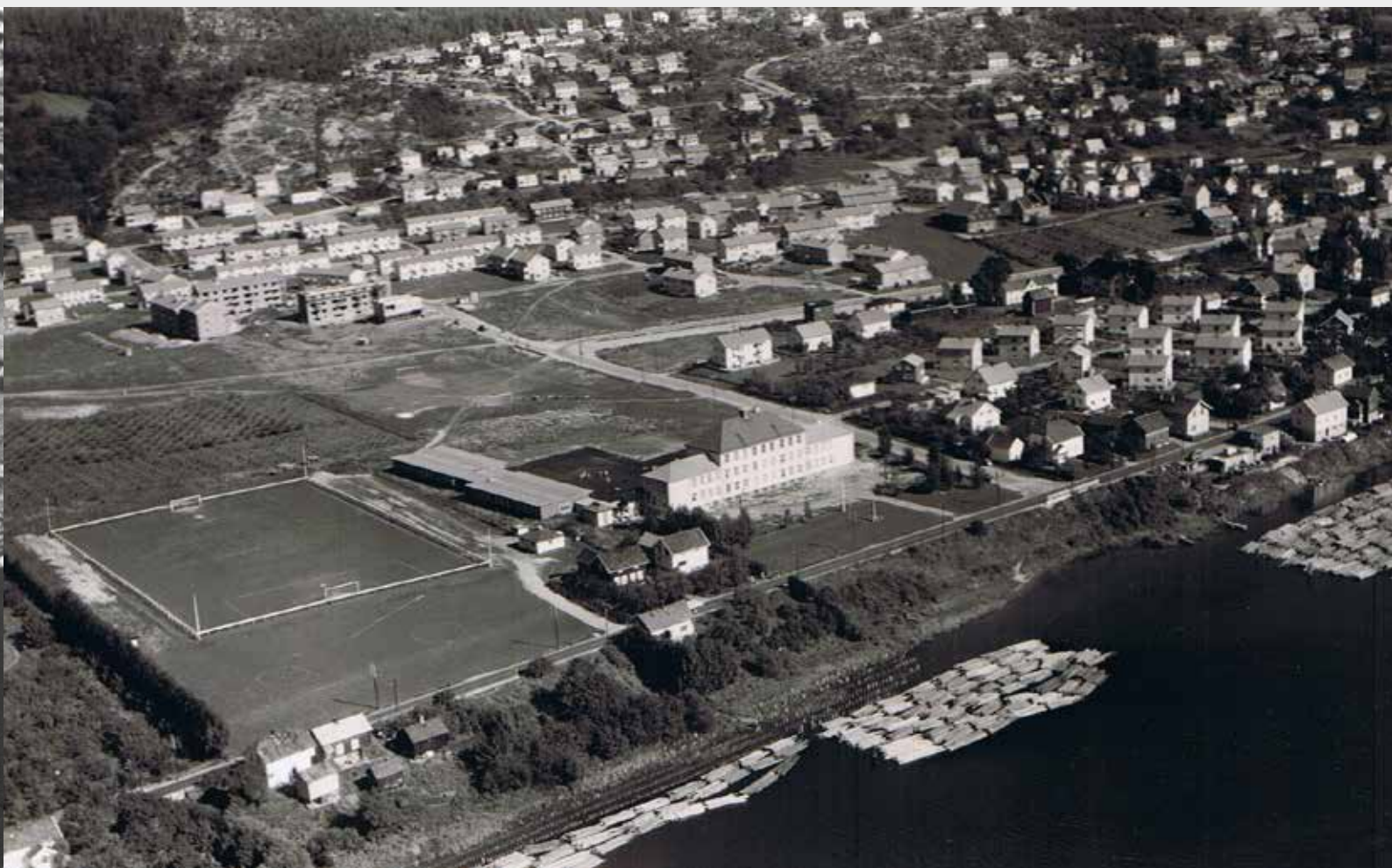
Åssiden før 1955.