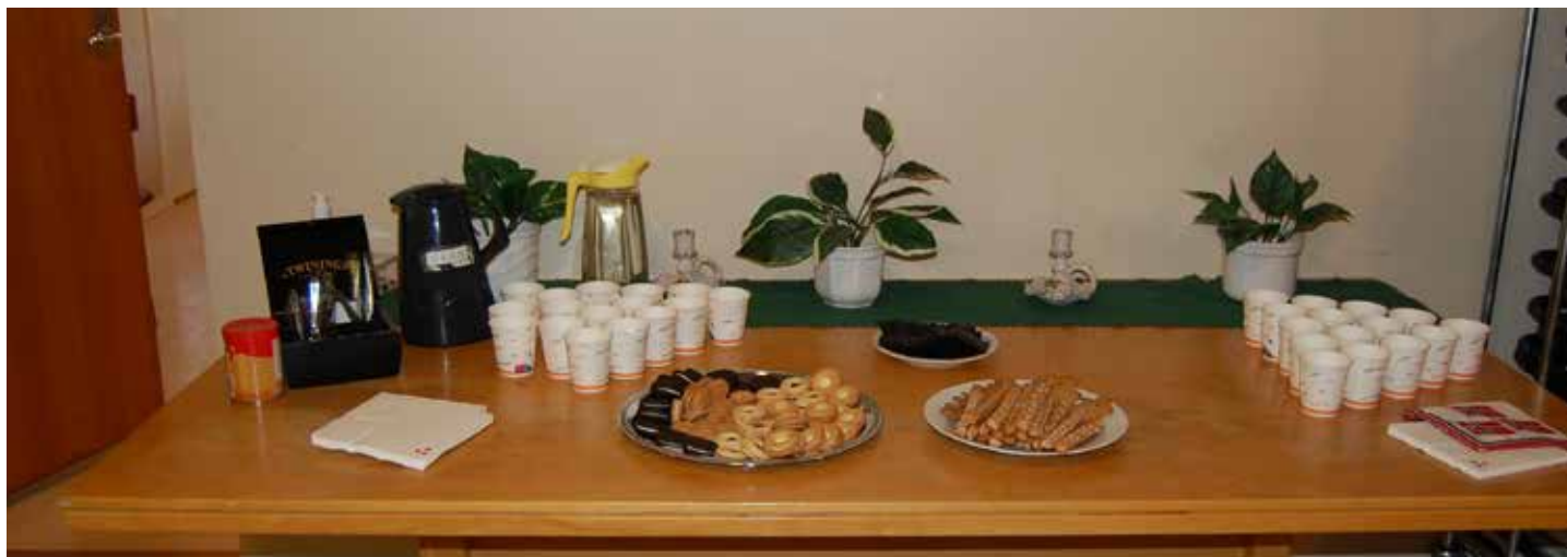
Kirkekaffe 14.05.-23. Vi greier oss selv om Menighetssalen er utleid

skrivende stund er vi allerede mange som har hatt anledning til å hilse på henne: hun ble presentert av selveste biskopen under kirkekaffen etter visitasgudstjenesten. Hun har deltatt i Torsdagstreff 4. mai, og i et planleggingsmøte med staben dagen etter. Så nå er det bare å glede seg!