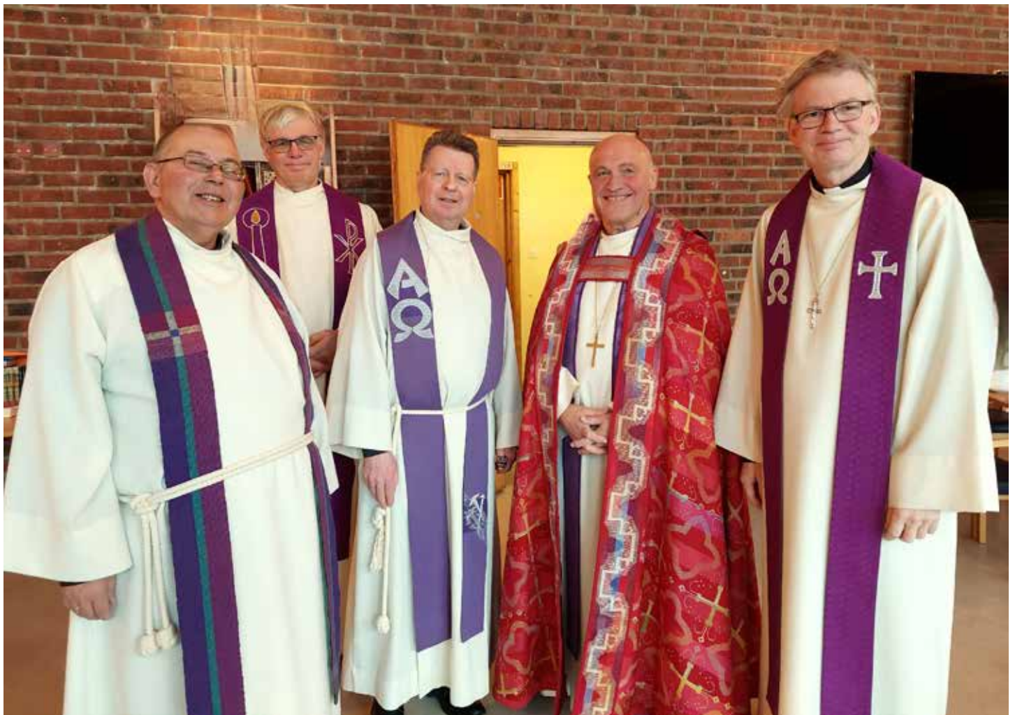
Bispevisitas mars 2023