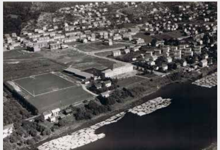
Åssiden rundt 1960

Jeg har fem personer som er mellom 72 og 76 år som er enig med meg, bildet er fra 1960 mener vi bestemt. Vi var samlet i kirka på onsdag og spiste boller og snakket om bildet og var enige. Så den gir vi oss ikke på.