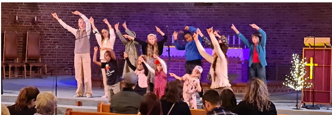
Fra barnas julekonsert i 2021