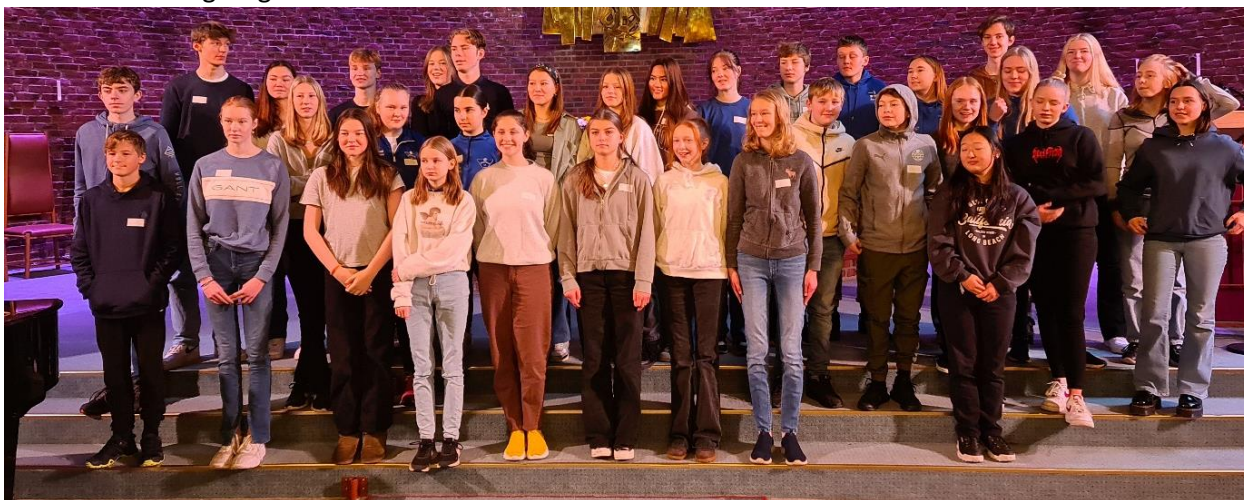
Nytt konfirmantkull presenteres i en av høstens åpne gudstjenester

På bakgrunn av statistikken for 2021 og av direkte tilbakemeldinger fra våre medlemmer, kan vi i hvert fall til en viss grad hevde at vi har lyktes med å skape alternative møteplasser i en tid hvor kirken har vært svært strengt regulert av smittevernsbestemmelser.