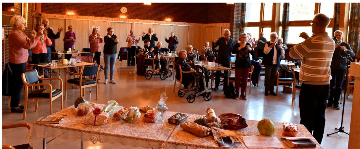
Torsdagstreff med trim, sosialt fellesskap, måltidsfellesskap, andakt og musikk. En viktig møteplass for eldre gjennom hele sommeren og høsten 2021

Men med øktet digitalt nærvær på webben har vi maktet å profilere lokalkirken på en ny måte. Om dette vil engasjere kirkens medlemmer og virke rekrutterende i fortsettelsen, gjenstår fremdeles å se. Ingenting kan erstatte fysisk fellesskap. Dette har vi merket enda mer jo lenger inn i pandemien vi har kommet.