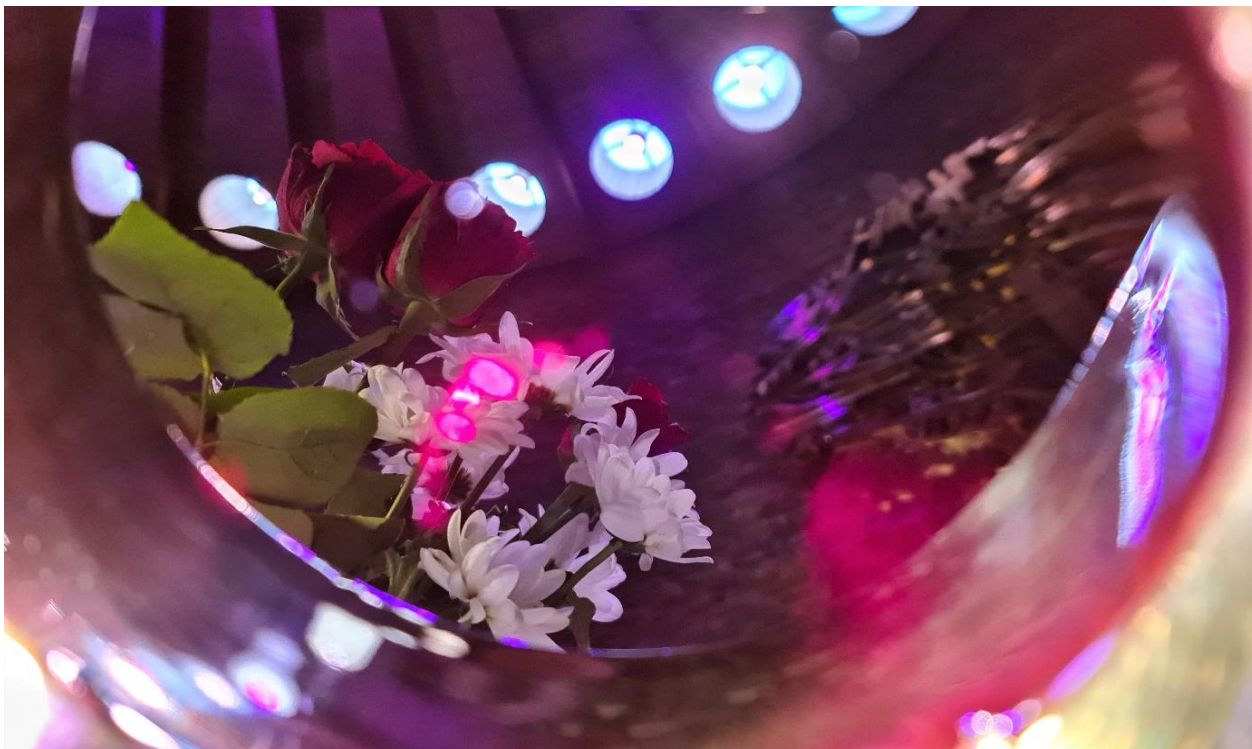
Fra Åssiden menighets digitale påskeprogram i 2021

antallet slike lokale produksjoner (ca. 40 innlegg/videoer med over 17 000 seere – så her har vi nådd langt ut over soknegrensene).