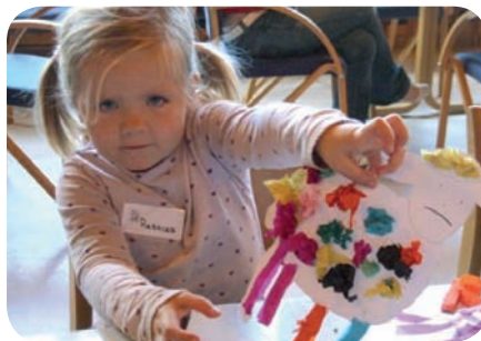
Her er sauen min. Er den ikke fin?