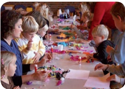
Her lager vi små lam som vi skal vise frem i kirken på søndag.

Det var liv og røre i Åssiden kirke denne lørdagen (11.okt). Når 40% av alle døpte 4 åringene kommer til kirken for å synge, lære og leke går det slett ikke ubemerket hen. En munter og livlig gjeng var de. Sammen fikk de forberede gudstjenesten på søndag da det blir høsttakkefest, og sammen fikk de øve på noen sanger som de skal synge i kirken sin. Slike gode møter mellom hjem og lokalkirke blir det flere av i tiden som kommer!