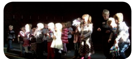
Litt må vi jo øve i kirken når vi skal synge til gudstjenesten.