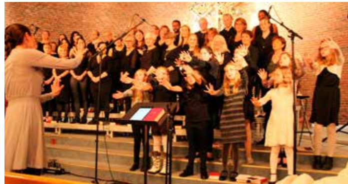
Gospel Tweens hadde øvet inn to av messeleddene og fremførte i tillegg to nye sanger.