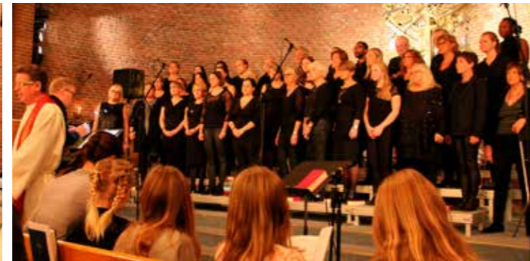
Drammen International Gospel Choir ledet menighetssangen, både de liturgiske leddene og salmene.

Det ble en veldig fin opplevelse for Gospel Tweens å være med på kveldsmessa, sammen med de andre korene i kirken. Planene fremover er at vi skal synges på julemessa lørdag 25. november kl.12:00, sammen med Minigospel. Vi skal også ha felles julekonsert med alle barnekorene i kirken; tirsdag 28. november kl.17:30 i Åssiden kirke. Torsdag 30. november skal vi bli med på den årlige Julegrantenninga i Vårveien, som starter kl.17:00, og mandag 11. desember skal vi være med på den aller første julekonserten som er blitt arrangert av Skoger kirke. Det gleder vi oss til!