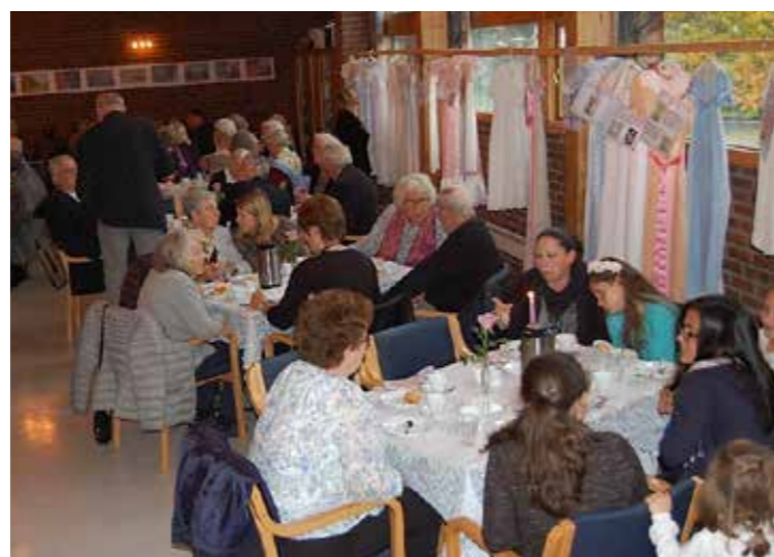
Kirkekaffen 1. oktober 2017

Ta gjerne kontakt med en fra kirkens stab hvis du er interessert i forhåndsbestilling!