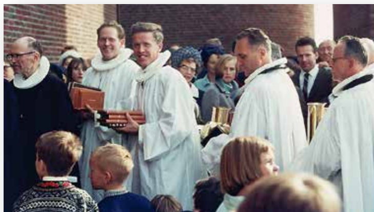
Innvielsen 1. oktober 1967.

I anledning feiringen av Åssiden kirkes 50-årsjubileum i 2017, vil det bli utgitt et jubileumshefte våren 2018.