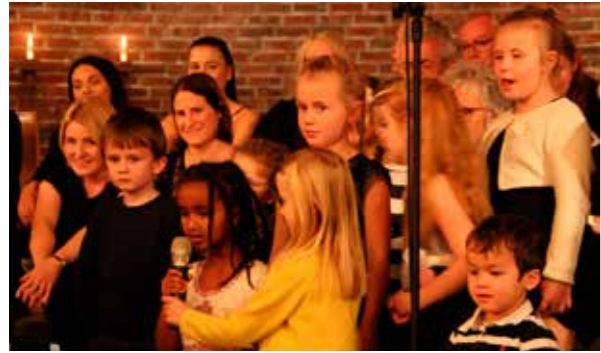
Minigospel var med og sang Halleluja før lesningen av evangeliet.