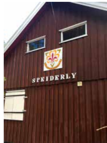
Nytt logo møter besøkende til Speiderly.

For ytterligere info, ta kontakt på tlf.: 916 29 302 eller mail: runar@drammenkm.com