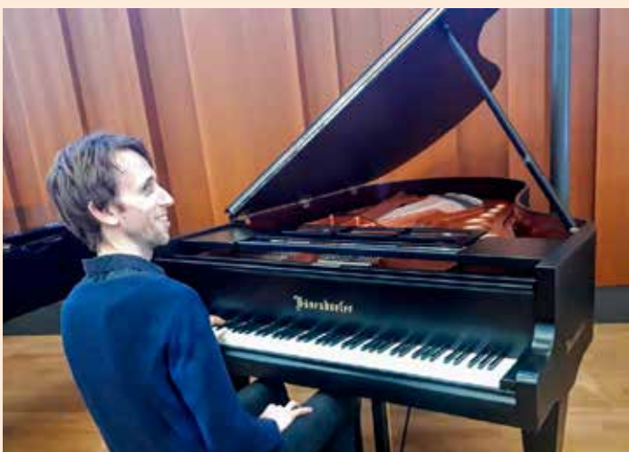
Organisten liker det han hører

Denne første dagen i Wien går med til å «lande» i byen, ta inn stemningen, alle inntrykkene og innstille sansene på rett frekvens. Derfor, etter et naturlig første kafébesøk for å spise utsøkt tilberedt Wienerschnitzel på Café Mozart, beveger vi oss i retning Musikverein (huset som hver 1.nyttårsdag har hele verdens øyne rettet mot seg og nyttårskonserten derfra) for å avlegge Bösendorfer Salon et lite besøk. Denne instrumentsalongen har i alle år vært uløselig knyttet til Musikverein da grunnleggeren Ignaz Bösendorfer var nær venn med lederskapet i Musikverein. Her får vi et første møte med det som venter oss dagen etter, og timene i salongen blir mange, det er ikke lett å forlate en slik musikalsk oase. Kvelden avsluttes med midtidsbesøk på komponisten Franz Schuberts favorittkro «Drei Hacken», og vi kjenner på det historiske suset i lokalet når Schubert titter ned på bordet vårt fra et maleri på veggen. Det blir en forholdsvis tidlig kveld i Wien første dag, viktige avgjørelser skal tas dagen etter, og det er viktig å ha opplagte øyne og ører.