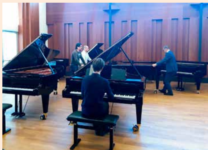
Alle instrumentene ble nøye prøvet ut