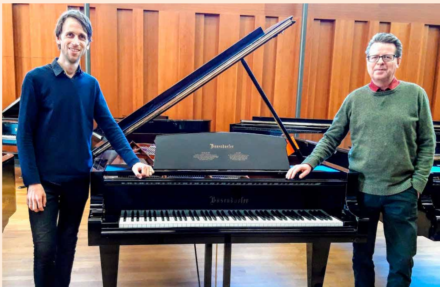
Fornøyd sogneprest og organist etter endt prøvespilling