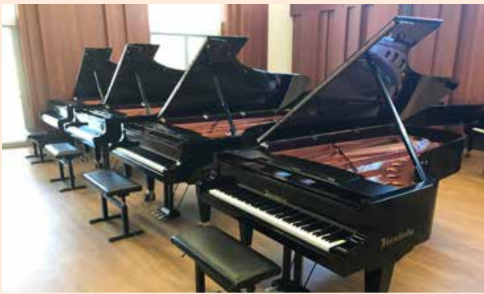
De fire kandidatene til prøvespillet