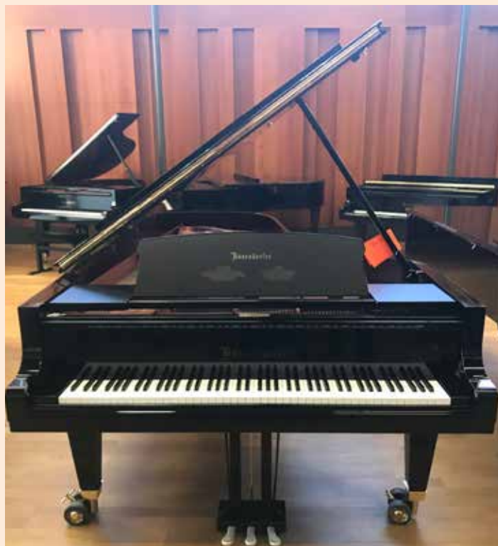
Vinnereksemplaret Bösendorfer Vienna Concert 280