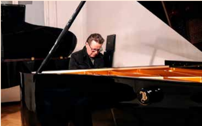
Vår sogneprest i konsentrert lytting