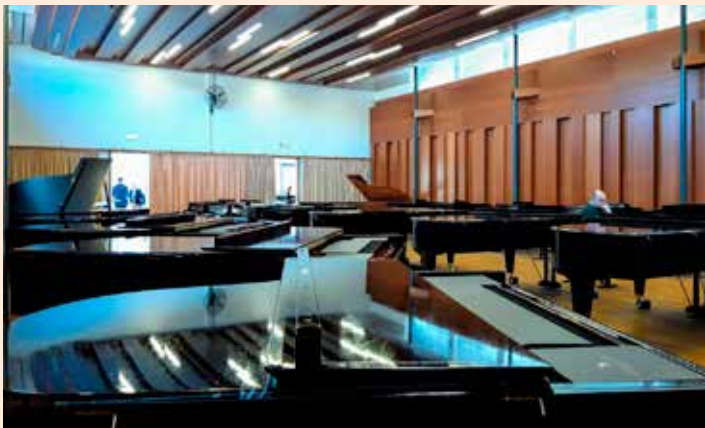
Enhver pianists paradis