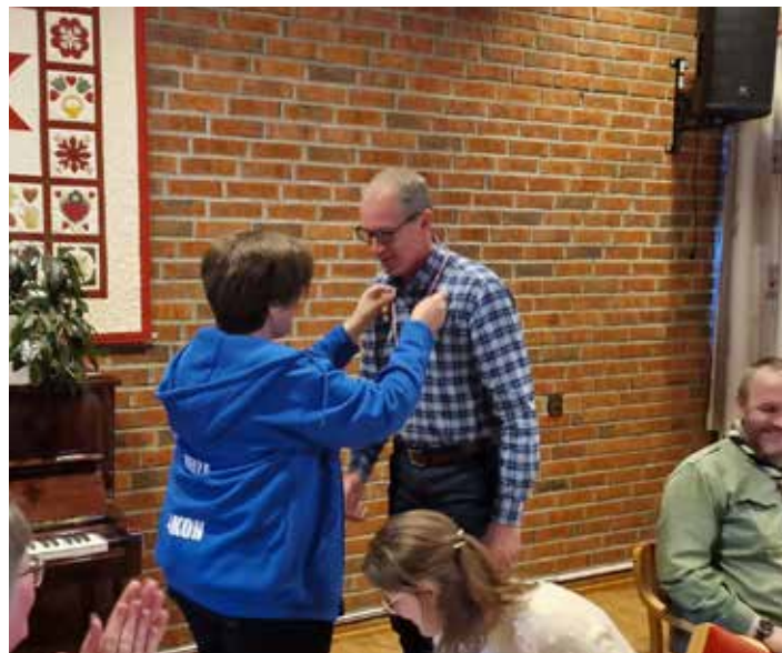
Frivillighetsmedaljen deles ut - ved loddtrekning