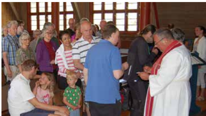
Vi feirer Sportskapellets 80-årsjubileum 2. pinsedag 2018