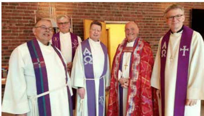
Bispevisitas mars 2023