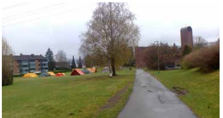
28. april Kretsbanner-konkurranse og overnatting med trening til sommerens store konkurranse