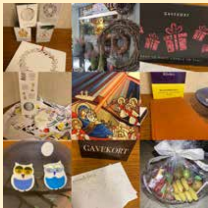
Gevinster digitalt adventsmarked