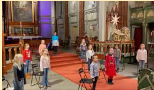
Innspilling med jenteaspirantkoret