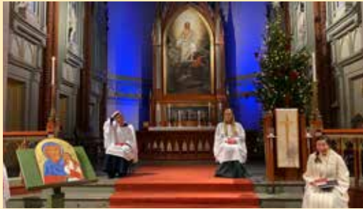
Innspilling av nyttårsaftensgudstjeneste