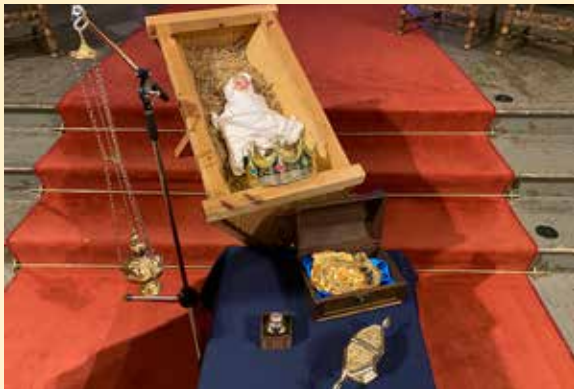
Gull, røkelse og myrra. Helligtrekongersdag