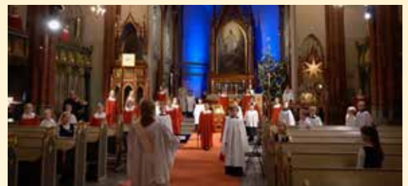
Julaftensgudstjeneste på nett