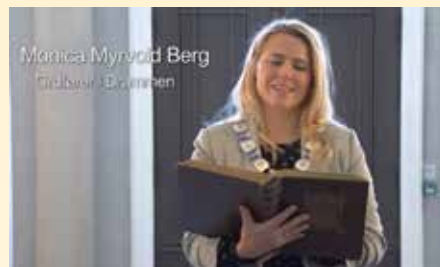
Juleevangeliet med ulike stemmer fra Drammen