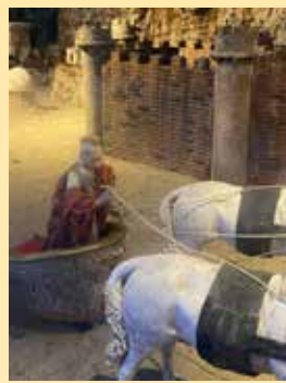
Romersk soldat med munnbind i julekrybben