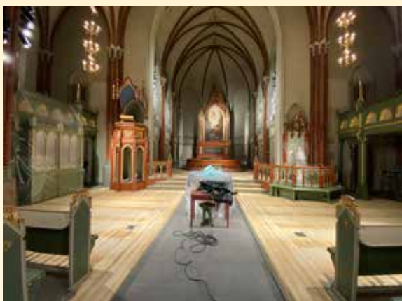
Oppussing av Bragernes kirke