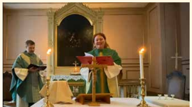
Innspilling av gudstjeneste i Strømsø kirke, mens Bragernes kirke pusses opp