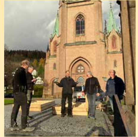
Dugnadsgjeng fra kirkekontoret hjelper til med rigging av julekrybben