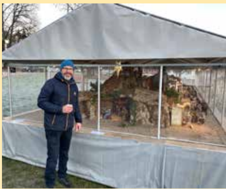
Julekrybben 2020 åpnet