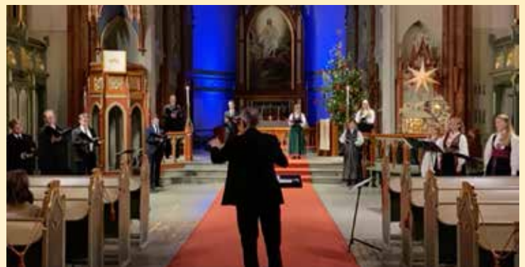
Midnattskonserten lille julaften hadde 10 tilskuere i kirken og ble strømmet direkte på nett