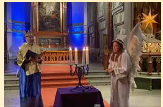
Innspilling av julevandring for førsteklassinger