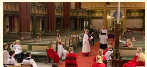
Innspilling av julaftensgudstjeneste med barn fra korene