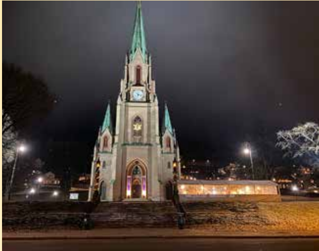
Adventsstemning ved Bragernes kirke