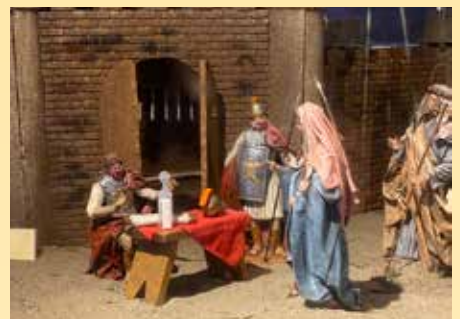
Også et av tablåene i årets julekrybbe var preget av pandemien. Antibac og munnbind