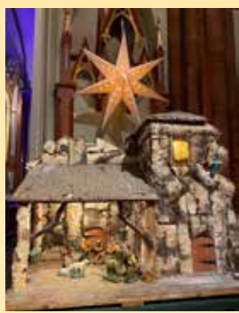
Julekrybben inne i kirken