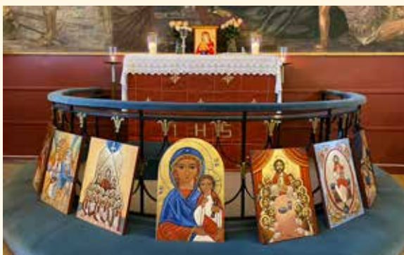
Ikonene ble flyttet inn i kapellet under oppussingen