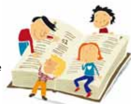
Ill.: Elisabeth Moseng