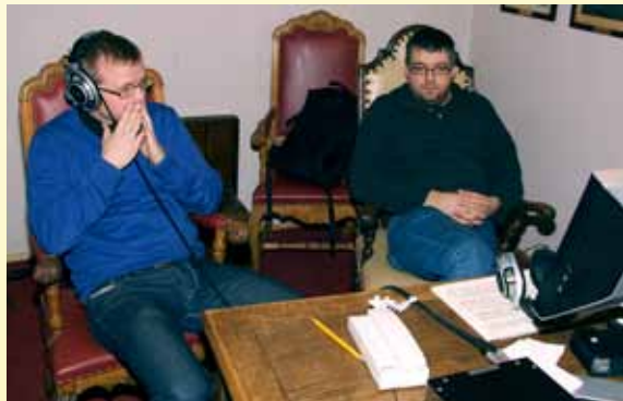
Musiker og produsent vurderer ett av mange optak denne dagen.