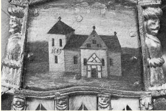
Akterspeilet på kirkeskipet fra den gamle kirken. Maleren byttet om sifrene i årstallet 1669. Det skal være 1699, som vist på bilder av steintårnet.

Kirken ble reist på Albumløkken etter den store bybrannen i 1866, da fem tusen mennesker mistet sine hjem på Bragernes. Bybrannen satte et helt tidsskille i Drammens