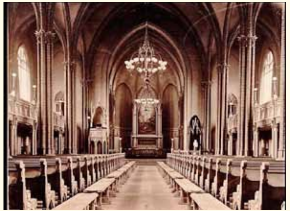
Foto av kirkens interiør da gasslysekronene var på plass seks år etter innvielsen.

I løpet av ett år ble den nye kirken reist. Innvielsen ble feiret med høytidsgudstjeneste den 12. juli 1871, nøyaktig på femårsdagen etter bybrannen.