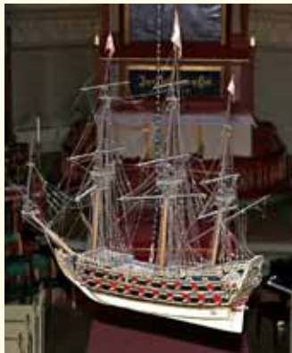
Kirkeskipet som ble reddet fra kirkebrannen i 1866, henger i dag i kirkerommet.

historie. Den eldste kirken på Bragernes var oppført på Gamle kirkeplass og innviet i året 1628. Kirkens offisielle navn var Hellig Trefoldighets kirke. Denne lille korskirken av tre fikk et nytt murt vesttårn i året 1699. Tårnet ble beholdt da det ble reist en ny korskirke av tømmer på samme sted i 1708. Det var denne kirken som ble lagt i aske under den store bybrannen i 1866. Da grunnforholdene var usikre på Gamle Kirkeplass, fant man tomt til oppføring av en ny kirke på Albumløkken som lå i aksene fra torget opp Kirkegaten.