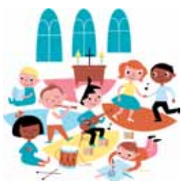
Ill.: Ingela Peterson