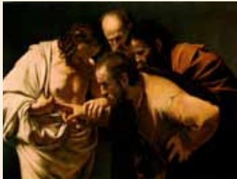
Tomas tvileren, av Caravaggio

Se program for messene i avisa og nettsidene til Bragernes!