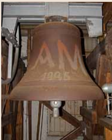
Den største klokken

Ringing: Selve klokken svinger på sin aksel. Dette er den vanlige bruken.