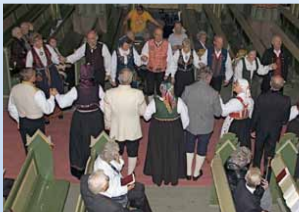
Dans i kirkens midtgang under søndagens gudstjeneste.

Den 29. mai var det folkemusikkmesse i Bragernes kirke med deltakelse fra Eiker spellemannslag, Leikarringen Bæringen og Leikarringen Noreg. De satte et festlig preg på gudstjenesten med rotekte musikk og dans.