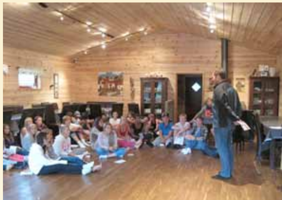
Samling i storstua

– å hjelpe hverandre – å klare ting sammen for å nå et mål og ja, det er jo riktig.