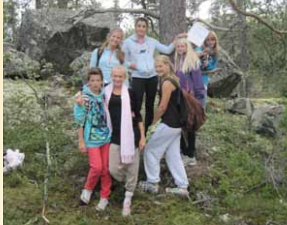
Oppgaveløsning på fjellturen