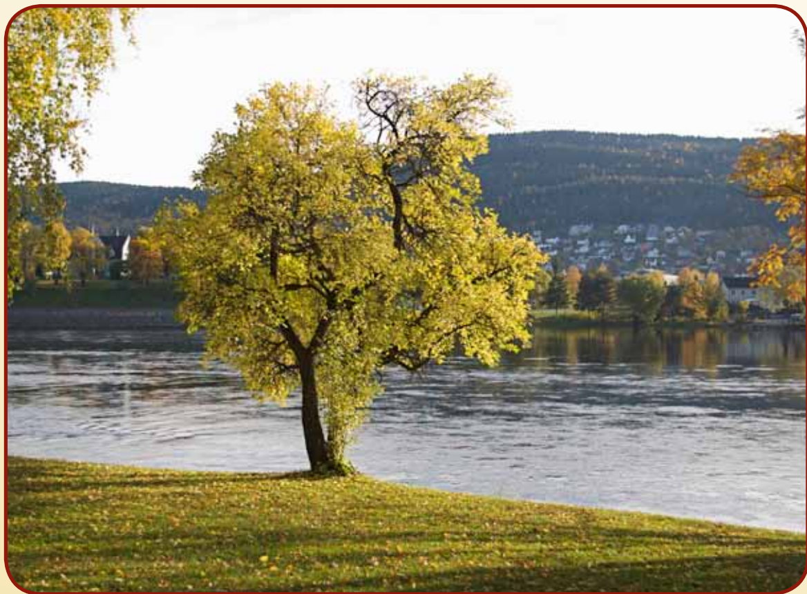
Høstsol over Drammenselven