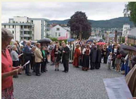
Fellessang på kirkebakken