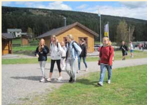
Ut på tur