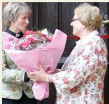
Fra åpningen av kirkeutstillingen.